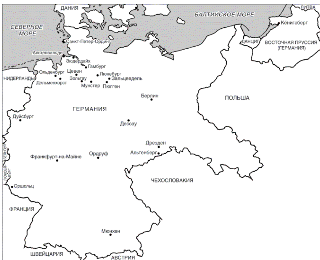
Германия в 1937 г.

Ввиду возможного военного конфликта в Европе и тяжелого положения в экономике послевоенной Германии мы с женой подумывали, не оставить ли нам наше отечество и попытаться счастья за границей, чтобы обеспечить себе более надежное будущее. Очень трудно было принять окончательное решение эмигрировать. Возвращаясь мыслями в минувшее, я понимаю, что это был поворотный пункт, когда я оставил в прошлом Германию и войну, чтобы начать новую жизнь сначала в Канаде, а потом переехать в Соединенные Штаты.