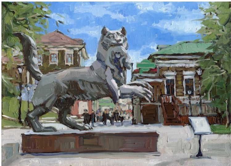
Бабр. Картина Алексея Яшкина