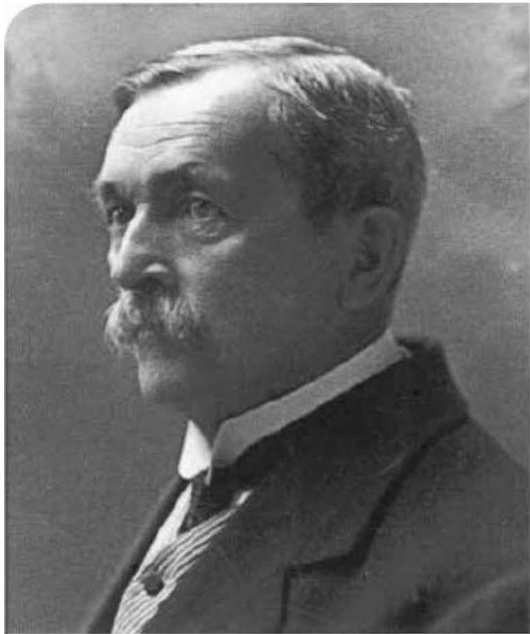
Жюль (Юлий Иванович) 1849–1920