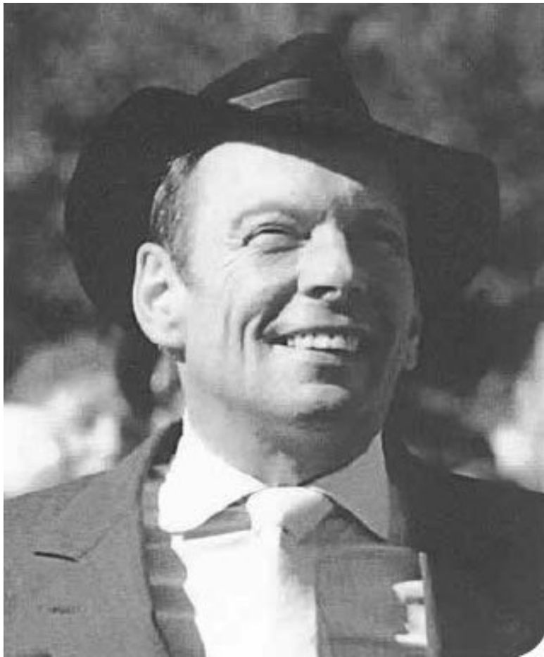
Рок (Юлий Юльевич) 1946-