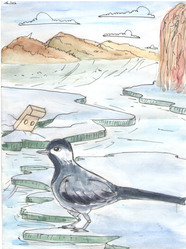
Расколдованный пруд. Ляшева Настя, 14 лет