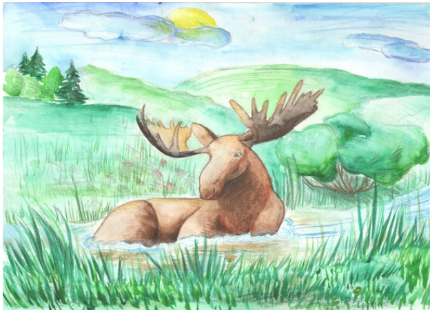
Лосинный родник. Лазарева Даша, 15 лет