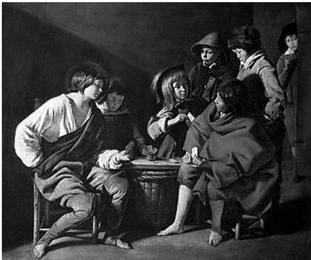
Луи Ленен. Игроки в карты.

Время от времени Сезанн отправляется в музей полюбоваться картинами и статуями. Экский музей открыт с 1858 года. Вначале он располагал всего лишь несколькими разрозненными образцами античного искусства да полотнами Клериана, бывшего хранителя этого музея. Постепенно он пополнялся. В 1849 году Гране, умирая, завещал музею кое-какие свои работы и коллекции. Еще несколько таких завещаний и дарственных, и каталог разбух. Сезанн смотрит картины, в большинстве своем произведения малозначительных французских и итальянских художников XVII века – «tenebroși», – близких по своей беспокойной манере к Караваджо и художникам барокко. Подолгу простаивает он перед картиной «Игроки в карты» – несколько застывших в довольно удачно найденных позах фигуры, – изучая это полотно, принадлежащее, как гласит каталог, кисти Луи Ленена.