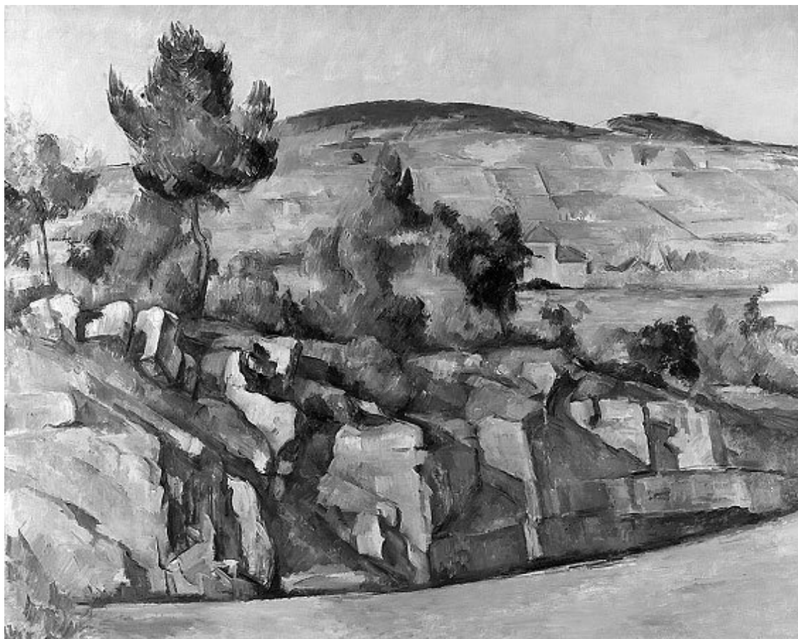
Поль Сезанн. Пейзаж в Эксе.