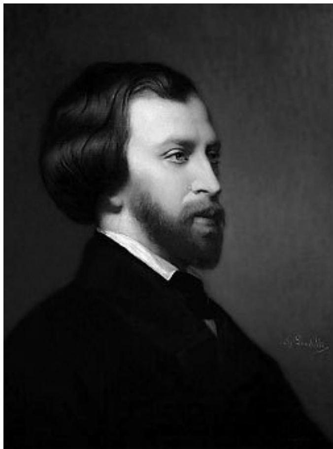
Шарль Ландель. Портрет Альфреда де Мюссе.

Волшебный мир поэзии! Неразлучные наперебой сочиняют стихи. Золя задумал даже написать большую поэму в трех песнях «Цепь поколений» – всеобъемлющую историю человечества, которая охватила бы сразу его прошлое, настоящее и будущее. Он, Золя, станет поэтом. И Сезанн тоже. И Байль тоже. Все трое станут поэтами. Чуждые мелочных стремлений, они будут жить в стороне от всех, вдали от людской злобы и глупости. Будут писать, познают славу и любовь. В один прекрасный день они нагрянут в Париж и завоюют его. В один прекрасный день к ним придет чистая, нетронутая любовь и утолит их жажду идеала. Книги закрыты. Золя лежит в траве на берегу реки и, устремив блуждающий взор в небо, изливает душу. Женщина, да, но он хотел бы, чтобы она была «как полевой цветок, что весь в росе распускается на ветру», чтобы тело и душа ее были подобны «водяной лилии, омываемой вечным потоком»; он клянется «полюбить лишь девственницу, целомудренное дитя, чья душа белее снега, прозрачней ключевой воды, а по чистоте своей глубже и беспредельнее неба и моря».