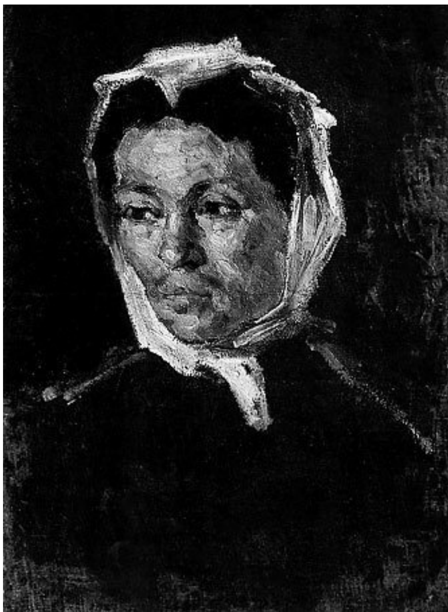
Поль Сезанн. Портрет матери.

Странный ребенок, этот четырехлетний Поль Сезанн, и далеко не всегда приятный. У него нет ничего общего с теми вечно улыбающимися карапузами, на которых матери не нарадуются. Такой же упрямый, такой же гневливый, как его отец, он всегда стремится поставить на своем, а иногда без всякого видимого повода начинает вдруг бесноваться, топтать ногами, пока не доведет себя до настоящего припадка, впрочем, припадок этот прекращается так же внезапно, как начинается. А между тем второго такого ласкового ребенка не сыскать. Он обожает сестренку Марию, обожает мать и обожает, да, обожает своего уже пожилого сорокапятилетнего отца, перед которым он трепещет, который отпугивает его, чей властный голос, едва в нем появляются нотки более жесткие, чем обычно, заставляет мальчика тут же сжаться и присмиреть. Да и кто же в доме на Бульваре посмел бы возразить, пусть даже мысленно, Луи-Огюсту?