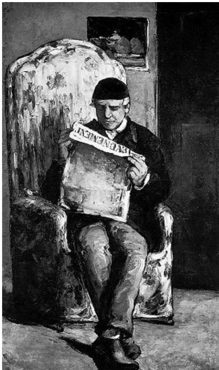
Поль Сезанн. Портрет Луи-Огюста Сезанна, отца художника, читающего «Эвенман».

Надо сказать, что кролиководы, снабжавшие экскую шляпную промышленность кроличьими шкурками, нередко бывали стеснены в средствах. Боясь, как бы их затруднения не сказались на делах, Луи-Огюст время от времени ссужал их деньгами – разумеется, под проценты. Вот тут он и заметил, что это само по себе недурной источник дохода. Он умножил подобного рода операции и вскоре стал присяжным заимодавцем не только эксовцев, но и жителей всего края. Забросив мало-помалу свой магазин, он в конце концов увлекся финансовыми сделками. Однако Луи-Огюст не мог развернуться так, как хотел бы, поскольку в Эксе уже имелся один банк, банк Барже на улице Ансьен-Мадлен. Надо бы самому открыть банкирский дом и конкурировать с Барже, да дело это, пожалуй, рискованное, раздумывал Луи-Огюст: удача отнюдь не вскружила ему головы.