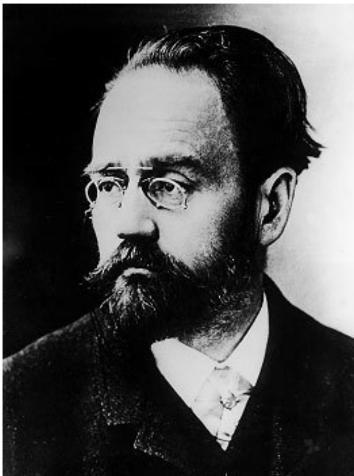
Эмиль Золя. Фотография.

ней мере можно всласть покуражиться, ведь он беззащитен: две втянутые в запутанную тяжбу женщины, что приходят к Эмилю, вряд ли могут ему чем-нибудь помочь.