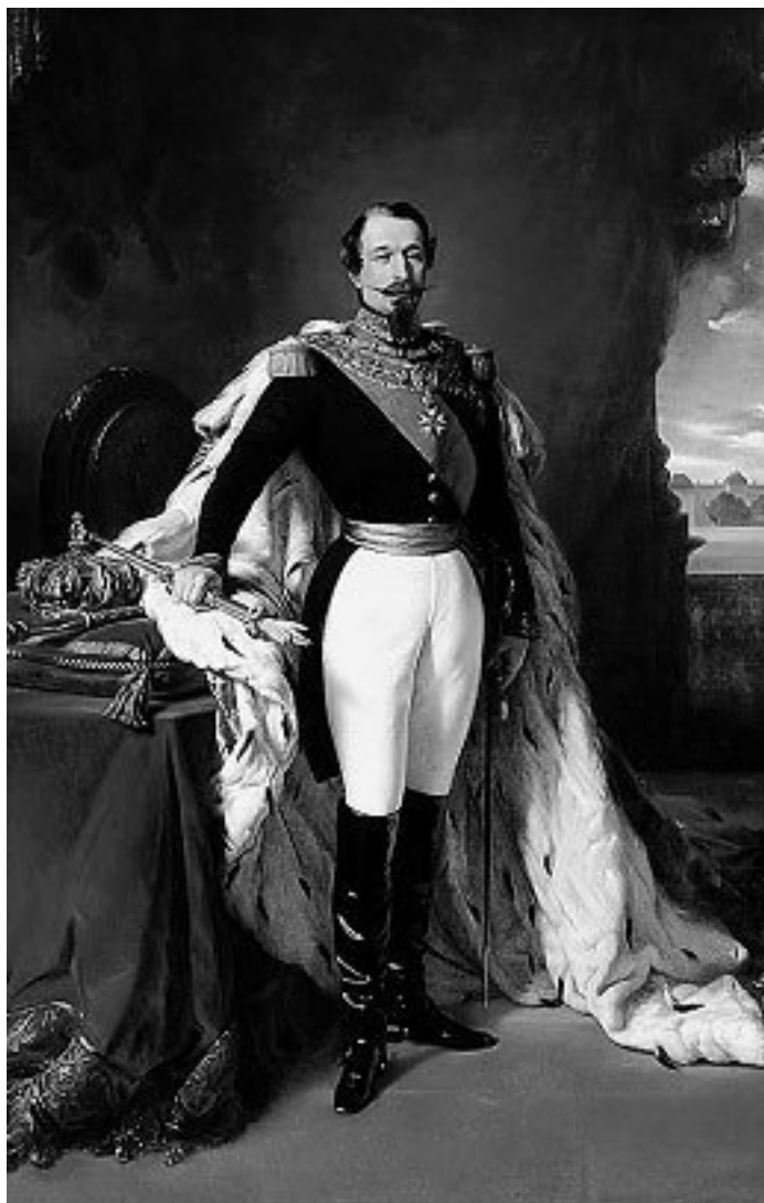
Франц Ксавье Винтерхальтер. Портрет Луи Наполеона Бонапарта (Наполеона III).

Сезанн унес домой свои награды – маленькие томики в синих полотняных переплетах. Несколько недель тому назад, точнее 30 июня, у него родилась сестренка Роза. Она плачет и кричит на весь дом. Но Сезанн не засиживается на улице Матерон. Неразлучные постоянно где-то носятся. Купание в Арке они чередуют с прогулками по окрестностям. Так как в этом году закончилось строительство плотины, запроектированной отцом Эмиля, то посещение ее, естественно, стало излюбленной целью их походов. А для Золя еще и своеобразным паломничеством.