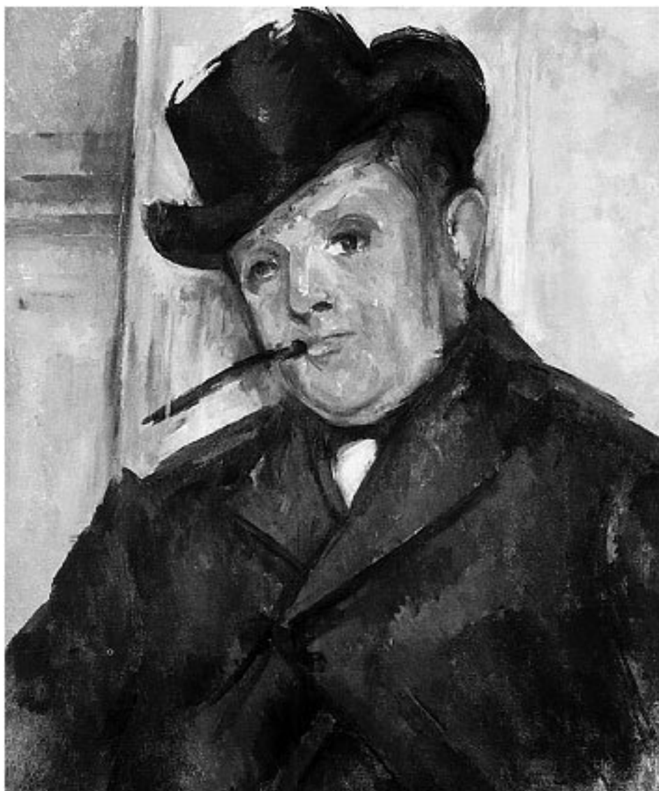
Поль Сезанн. Портрет Анри Гаске.

Поведение его зачастую кажется странным или по крайней мере неожиданным. Он слишком подвижен, наделен чересчур острой, почти болезненной восприимчивостью, чтобы можно было правильно понять его, одновременно такого шумного и робкого, равнодушного и страстного, нелюдимого и общительного – все в зависимости от обстоятельств, от смены настроения, различных вытесняющих друг друга впечатлений, какие он получает от живых существ и вещей. Он до такой степени поддается воздействию окружающей среды, что школьные учителя корят его за слабохарактерность. Но время от времени, пожалуй даже слишком часто, он вдруг, не помня себя от приступа необъяснимого гнева, как заупрямится, как встанет на дыбы!.. Совершенно непонятно, тем более что подобная несдержанность не мешает ему быть самым прилежным учеником. Своими успехами он обязан не столько выдающимся способностям, сколько усидчивости и умению работать систематически. Он, как говорится, звезд с неба не хватает.