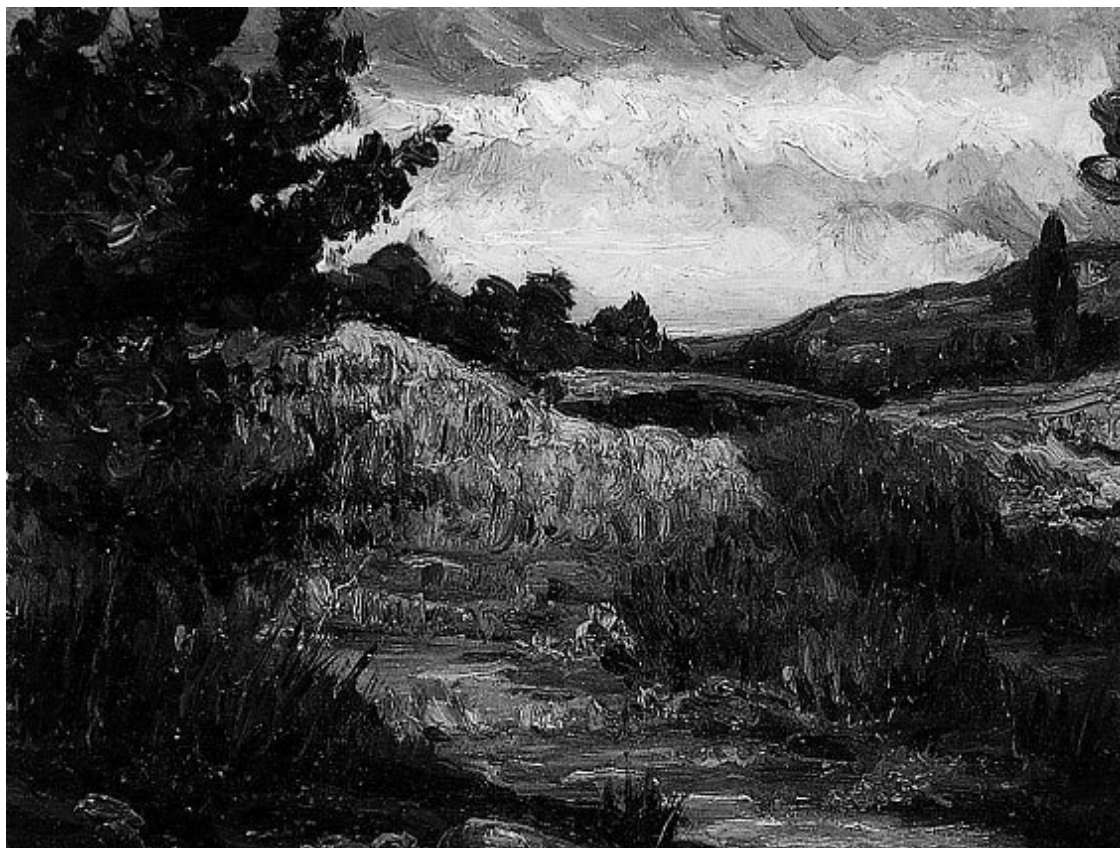
Поль Сезанн. Гора Сент-Виктуар.

В четыре часа утра (кто встает первый, будит другого, бросив два-три камешка в закрытое ставнями окно) друзья пускаются в путь-дорогу, с каждым разом стремясь уйти подальше и принуждая себя ходить подольше, наслаждаются этими все более и более длительными прогулками, доводящими их до такого изнеможения, что, когда вечером они входят в Экс, сияя тупой, блаженной улыбкой усталости, ноги отказываются им служить, и только «сила, которой они набрались», да какая-нибудь поэма Гюго подстегивают их слабеющую энергию и заставляют шагать в такт стихам, «звонким, как звуки трубы».