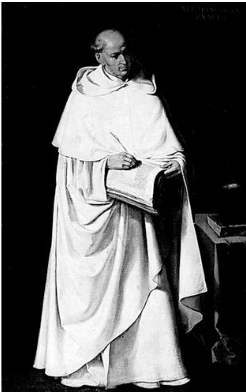
Франсиско Сурбаран. Портрет Брата Сумел Франсиско.

Как? Уроки рисунка? Г-н Мане живо вострепнулся. У него три сына. Для каждого из них давным-давно уготовано жизненное поприще. Эдуар и Эжен будут судьями, Гюстав – врачом. Рисунок! Чем может помочь рисунок в жизни Эдуару Мане? Пусть лучше ему об этих глупостях и не заикаются. А Эдуару следовало бы уделять больше времени урокам и школьным заданиям. Дядюшка – а он недавно получил чин подполковника – больше к этому разговору не стал возвращаться. Просто через несколько дней, оставив без внимания доводы зятя, он отправился в коллеж Роллен и попросил г-на Дефоконпре записать Эдуара на дополнительные уроки рисунка. Платить за них будет он сам, подполковник.