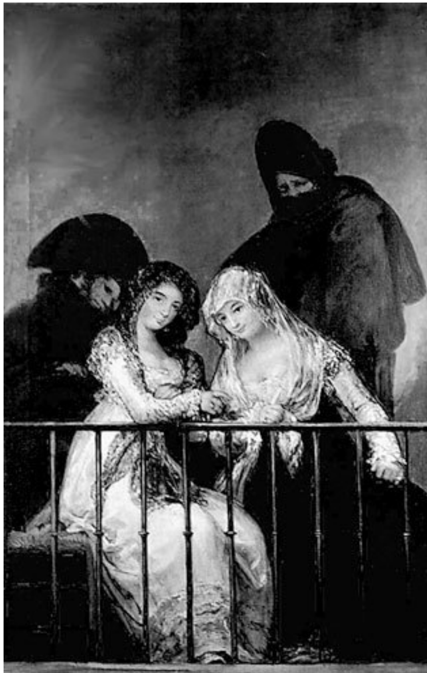
Франсиско Гойя. Махи на балконе.

Дальше – больше. Занятия в коллеже Роллен возобновились. Смысла от того, что Эдуар остался в пятом классе на второй год, никакого: по сравнению с прошлым годом он так и не достиг лучших результатов, кроме разве истории, где один-единственный раз, в мае, был удостоен второго места. «Этот ребенок мог бы успевать куда лучше; правда, намерения у него хорошие, но он несколько легкомыслен и не так прилежен в выполнении школьных заданий, как хотелось бы». Но дядюшку Фурнье это ничуть не интересует – он одно вбил себе в голову и как-то за воскресным обедом настоятельно советует г-ну Мане записать Эдуара на дополнительные уроки рисунка, которые проводятся в коллеже Роллен.