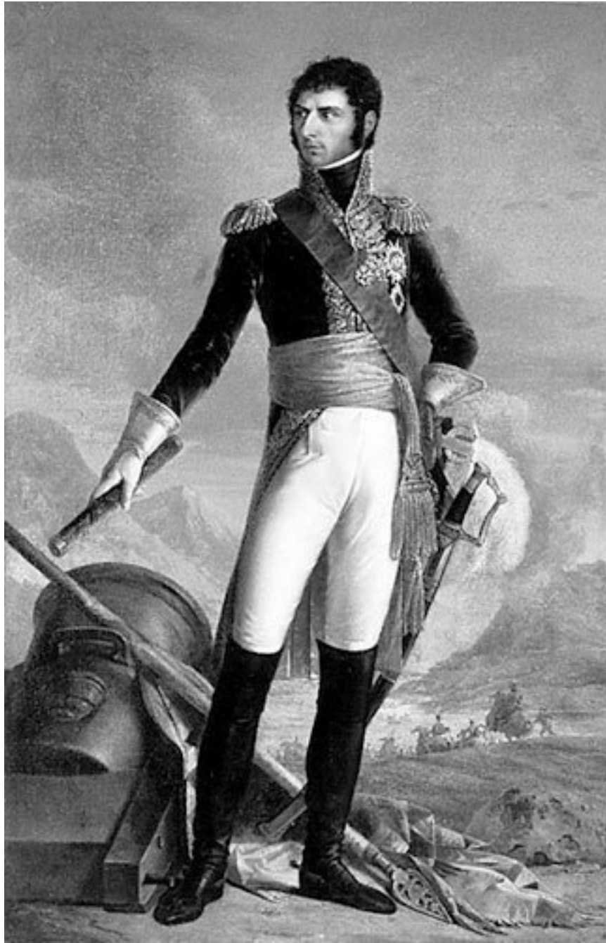
Жозеф-Николя Жуи. Копия с оригинала Франсуа-Жозефа Кинсона. Карл XIV Юхан (Жан-Батист-Жюль Бернадот).

В 1810 году, когда разворачивались события в Швеции, Жозеф-Антуан-Эннемонд Фурнье 13 , прежде занимавшийся коммерцией в Ганновере, а затем в Гётеборге, обанкротился. Он вернулся во Францию.