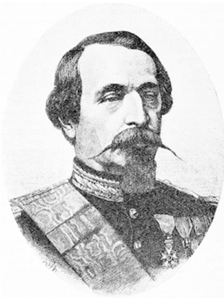
Луи-Наполеон Бонапарт (Наполеон III).

К восьми часам вечера, исполненный чувства глубочайшего удовлетворения от первого дня на борту, он замечает на горизонте свет далекого маяка. Последний знак, посылаемый землю Франции.