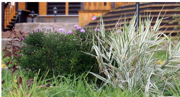
Астра и фалярис летом

Красивые резные листики образуют кустик шаровидной формы, который всё лето держит форму и напоминает хвойный шарик. Астру за счет за счет формы кустика можно применить в невысокой живой изгороди – бордюре.