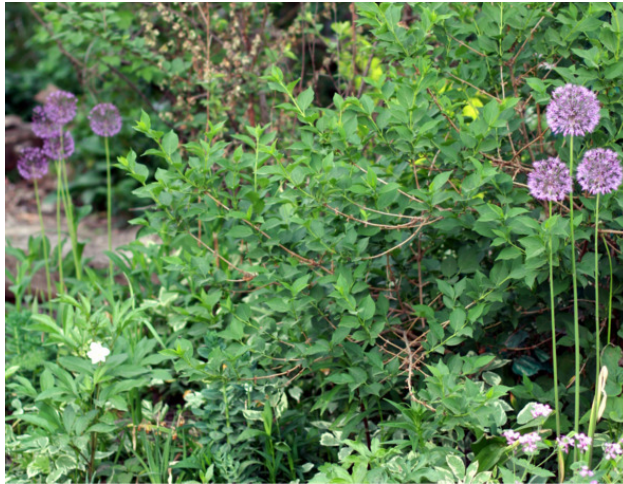
Аллиум в саду

Фиолетовые ажурные помпоны в последнее время становятся желанными гостями обычных участков, куда они перекочёвывают с выставок авторских садов. Действительно, при всей своей неприхотливости выглядят они эффектно и современно.