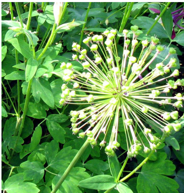
Созревшее соцветие алиума