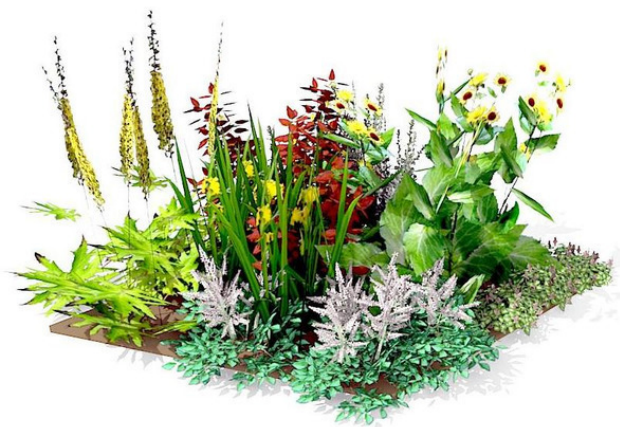
Эскиз клумбы с астильбами, ирисми, бузульником, вейбейником и т. д.