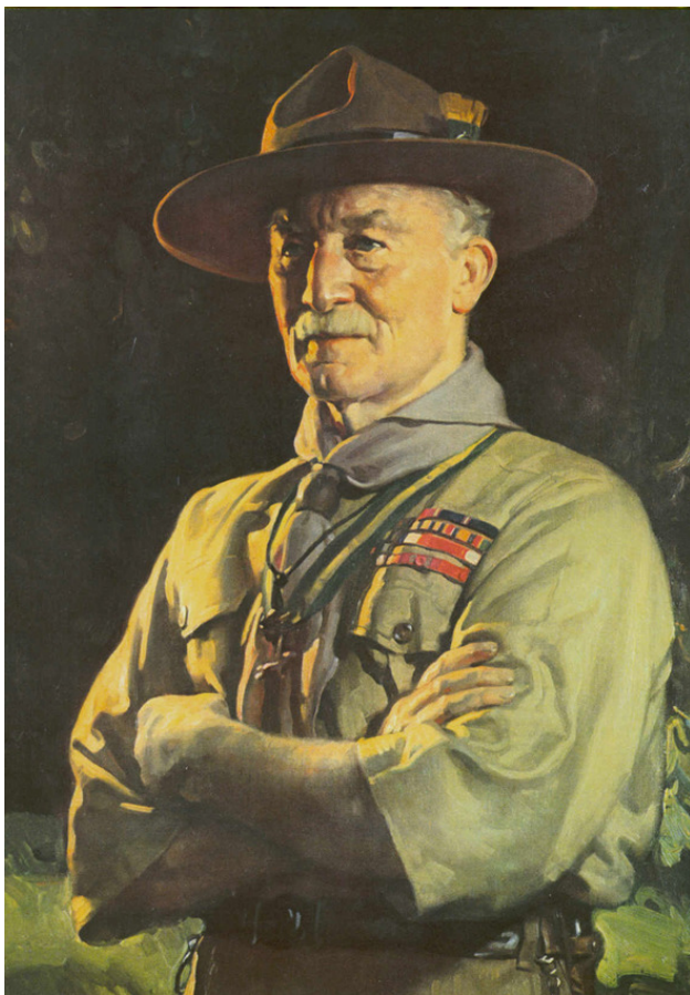
Роберт Стивенсон Смит Баден-Пауэлл создатель движения скаутов

Скауты объединяли молодежь аристократии и среднего