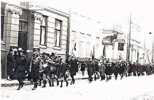
Мари российских скаутов

Общество скаутов объединяло взрослых, желавших помочь работе скаутских отрядов (единой организации русских скаутов так и не было создано в России) членов скаутских дружин.