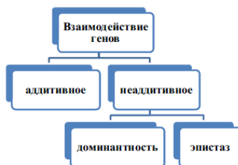
Рис. 1. Типы взаимодействия генов

Таким образом, генетический вклад в становление индивидуальности человека представлен не только уникальным генотипом (идентичными генотипами обладают только монозиготные близнецы), но и различными типами взаимодействия разных участков генотипа между собой.