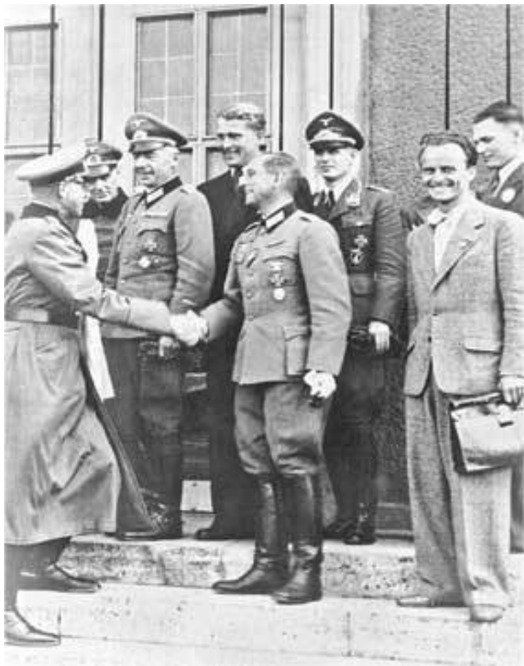
Генерал Фельгибель (слева) пожимает руку генералу Вальтеру Дорнбергеру (в центре)