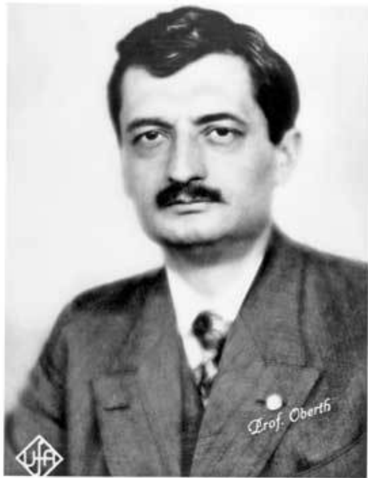
Один из основоположников современной ракетной техники Герман Оберт