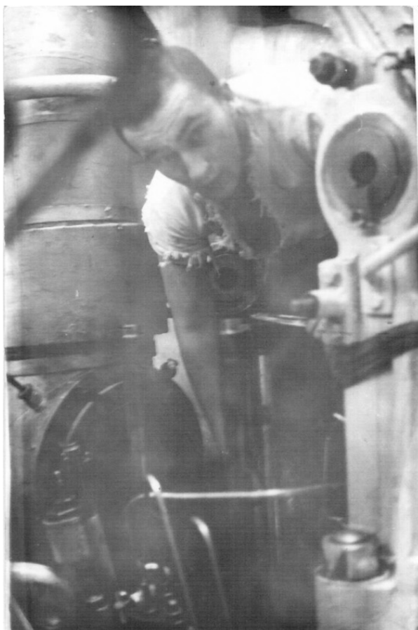
Палыч в машинном отделении