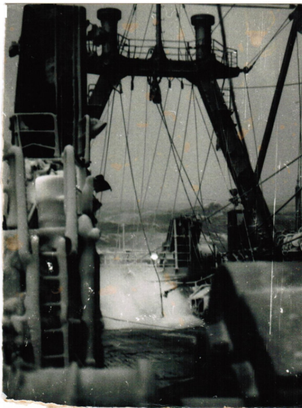
Антарктика. Начало 90 гг. Супертраулер.