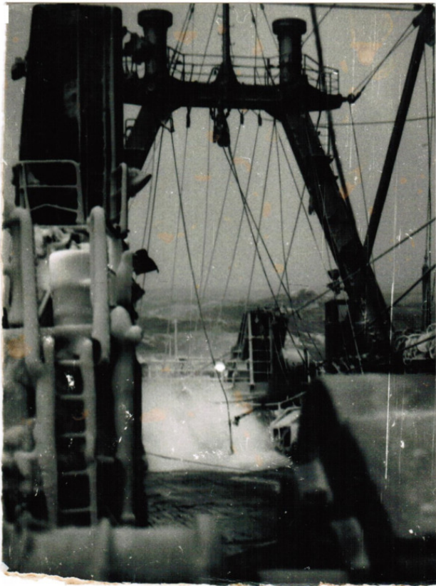
Антарктика. Начало 90 гг. Супертраулер.