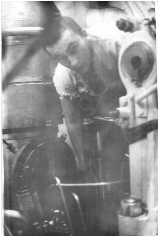
Палыч в машинном отделении