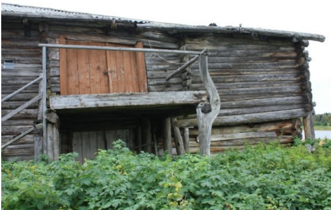
Взвоз на пове́ть.

Ну чем не Кимжа или Едома? Такой вот взвоз забавный на пове́ть . Обратите внимание на правый столб.