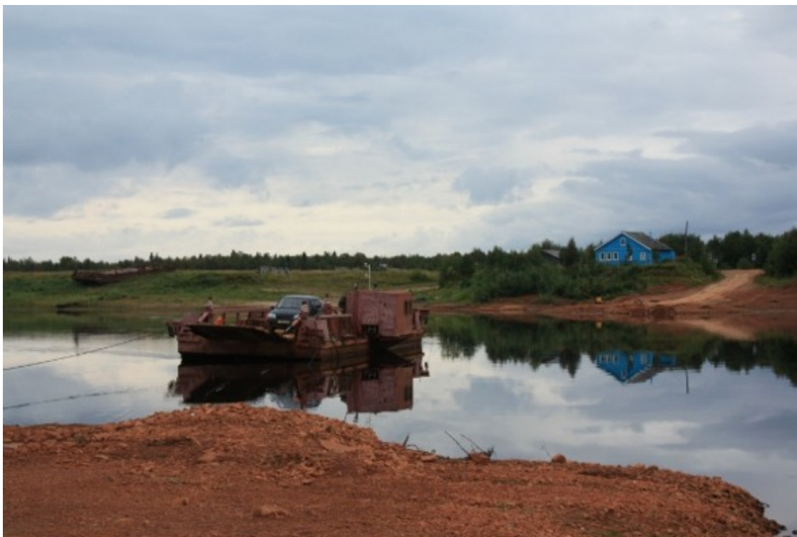
Паром через Пёзу

Через широченную у Кимжи Мезень в этом году понтон. А вот через Пёзу – паром. Смешной паромчик через Пёзу вмещает в себя пару-тройку машин, зато работает «по факту»: подъехала машина – он и едет.