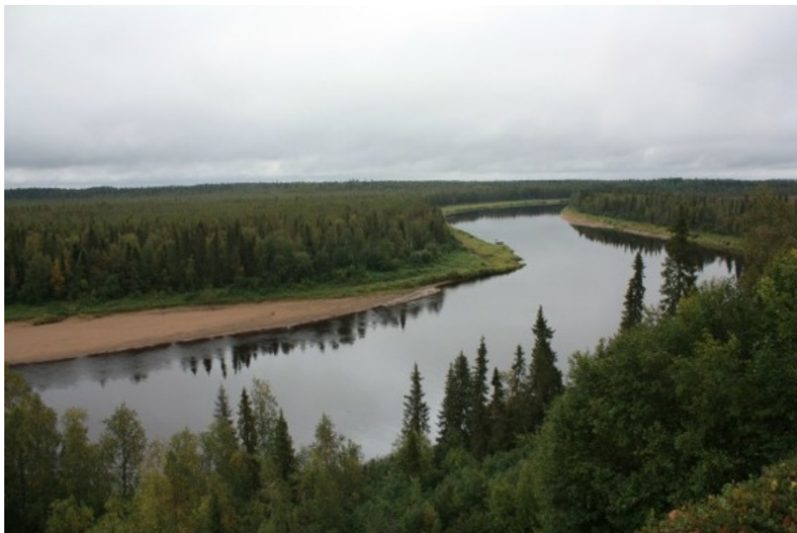
Пёза с Зажёгиных Холмов.