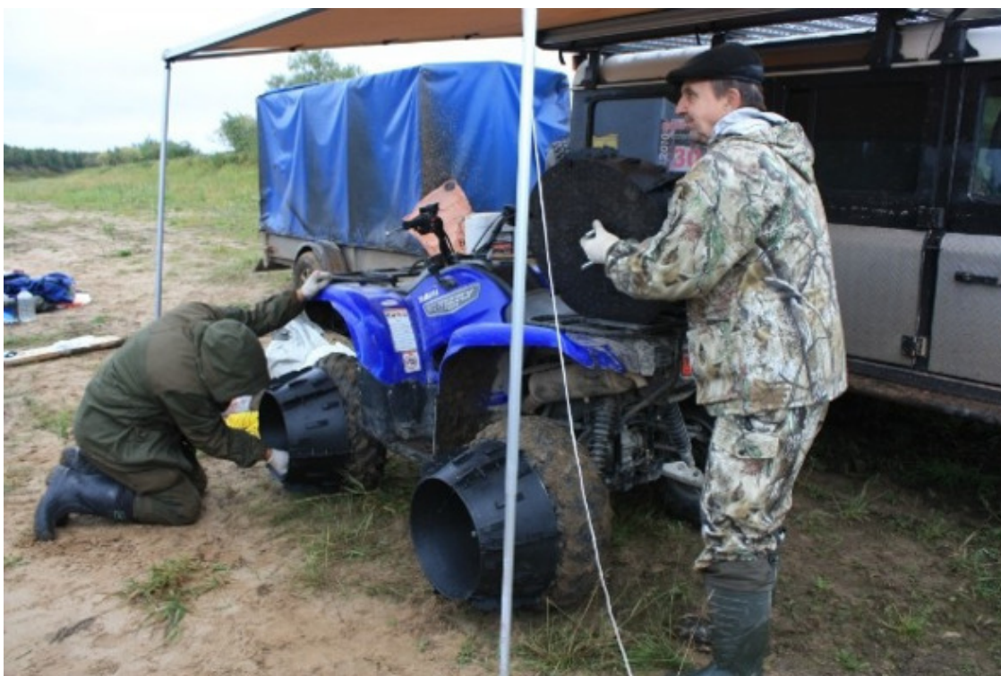
Болотные расширители колес.

«Гризлик» с прицепом. Болотные расширители колес (изобретателю – памятник). На фото их ставят на место. Интересно, поплывет ли квадрик с ними? По няше идет уверенно.