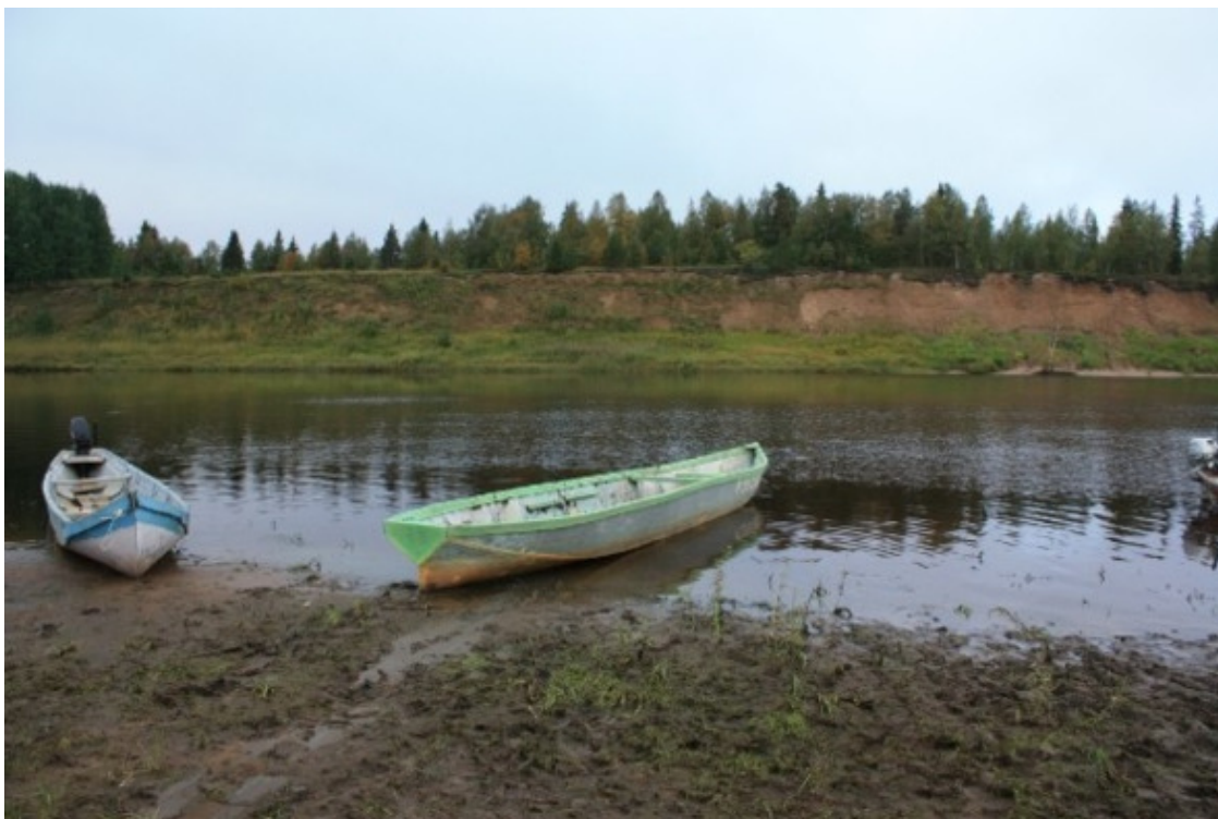
Лодки на Пёзе