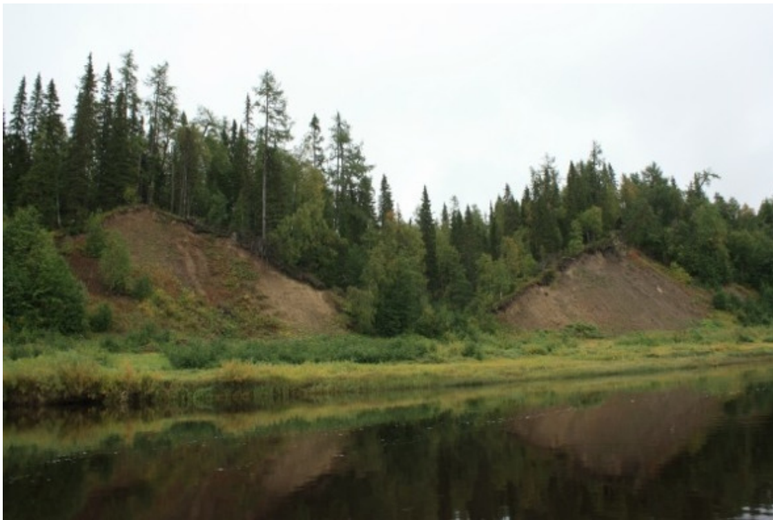
Пёза у Вирюги.

Выспавшиеся и довольные, в 8—15 мы уже на реке. Безветренно и очень тепло, что даже проснулась мошкара. За Вирюгой лес вплотную подошёл к воде. Берега здесь высокие, лес очень плотный, лиственницы с обеих сторон. Но такой лес годится только на дрова, сетуют проводники. Потому и зовётся он тут удоровье . В районе выхода зимника, срезающего петлю у Вирюги, стая гусей села на воду. Взлетела и развернулась. Красота.