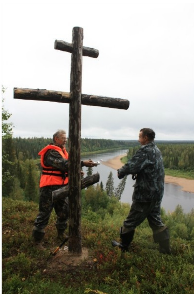
Крест на Зажёгиных Холмах.

Злодей – Зажёга. Зажёгины Холмы. Крест. Нестыковка?