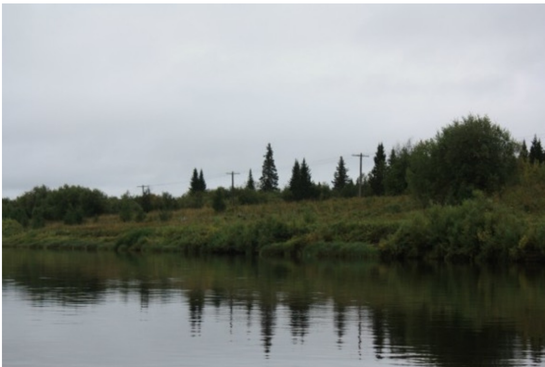
Линия связи на Пёзе

Пробуем разные комбинации – очень уж нам не нравится «Ветерок» на «резинке». Этот мотор не хочет работать на малых и средних оборотах – только на максимуме, но тогда бензин через него льётся, похоже, в реку напрямую.