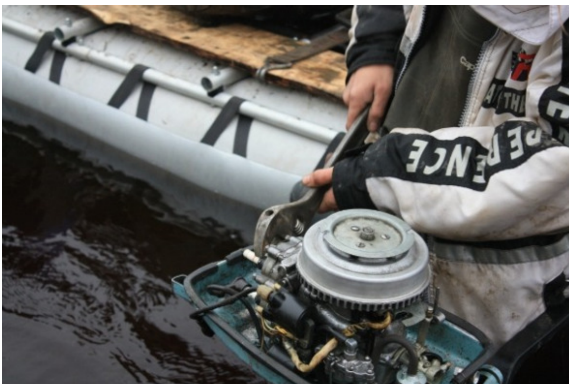
Тонкая настройка двигателя

А резинка начинает отставать. И «ракета» идёт пока на средних оборотах – движок же новый. Тем не менее, пытаемся замерить определяющие параметры – скорость и расход топлива. «Ракета» идёт примерно 6 км в час, добавление оборотов до максимума дает целых семь с половиной – похоже, с графиком я просчитался. Идти на полных 7 с половиной – смысла нет, поскольку такой режим увеличивает расход топлива почти вдвое – не та плата за полтора километра в час выигрыша. От измерений отвлекает вдруг замолкший «Ветерок», поначалу установленный на резинку. Ага, наскочили, то ли на камень, то ли на пережат, и срезали шпонку. 19—30, ремонт. Димон параллельно занят тонкой настройкой двигателя.