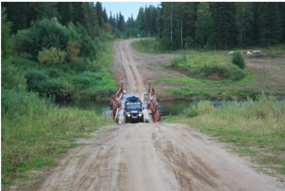
Дорога на Бычье.