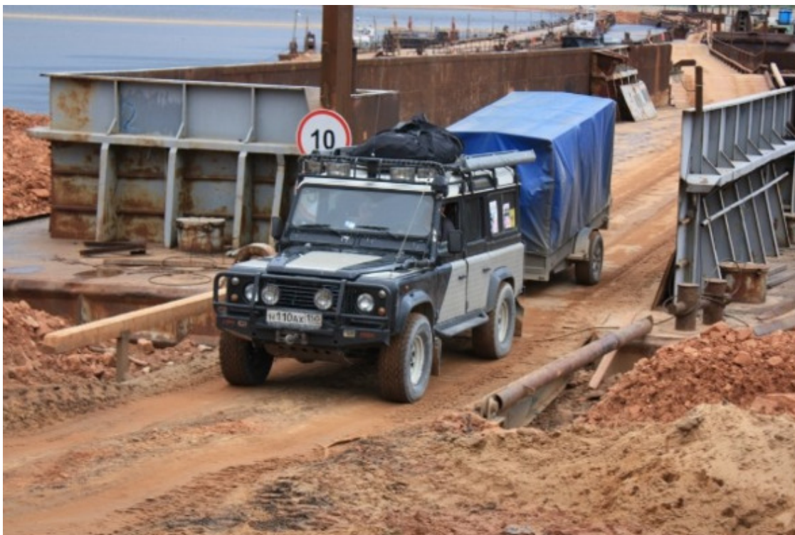
Экспедиционная машина – «Деф» – на выезде с парома. Мезень.