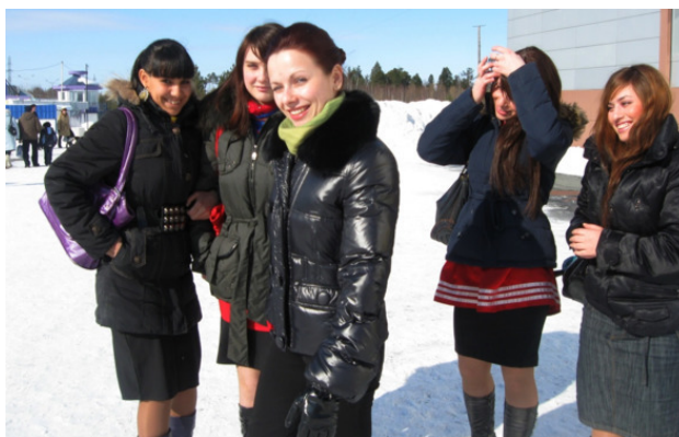
г. Пыть-Ях. Вокальный коллектив «Встреча»

Хочется продолжить рассказ о родном крае, о природе, о её красе и уникальности. Пыть-Ях – город красивых людей. И как не согласиться с этим толкованием. Всю сознательную жизнь я прожила в этом замечательном городе, да и сейчас общаюсь с друзьями. Вспоминаем красивую зиму, удивительное небо, сказочную природу и ландшафты. Почему зима? Больше всего запомнилось. Зима окутала своим белым покрывалом всё вокруг. Эти красивые места близ горнолыжной базы, сказочные закаты и рассветы. От такой красоты душа радуется и поёт. А ещё сердечко моё сильнее стучит. Слышите? Тогда покажу вам, мои дорогие, свои стихи о нашем крае, о нашем городе.