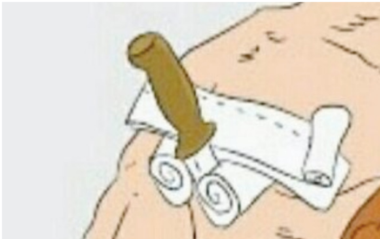
Рис. 3. Фиксация инородного предмета