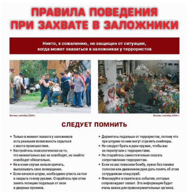
Рис. 1. Пример памятки – рекомендации по правилам по-