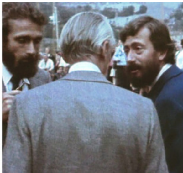
Принц Ренее III Жак Ив Кусто с сыновьями