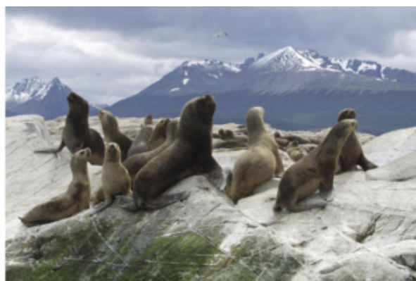
У берегов Магелланова пролива

Группа Филиппа Кусто отправляется в живописную бухточку, в которой вертолет-разведчик обнаружил небольшое стадо морских котиков. Мы рады засвидетельствовать, что эти царственные красавцы, которых люди чуть не истребили за их прекрасный густой мех, вернулись на свои исконные лежища. Эти места труднодоступны для зверобоев, поэтому котикам здесь рай. Они наслаждаются жизнью, играют, чистят свои длинные усы. На берегу они не прочь заняться ухаживанием: игривая самка донимает молодого самца. Она щиплет его за шею, дергает за усы. Они не боятся пришельцев с резиновыми ластами, выходящих из морской пучины, и не обращают на них внимания.