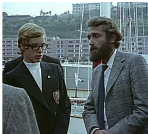
Альбер Фалько Принц Альбер и Филипп Кусто