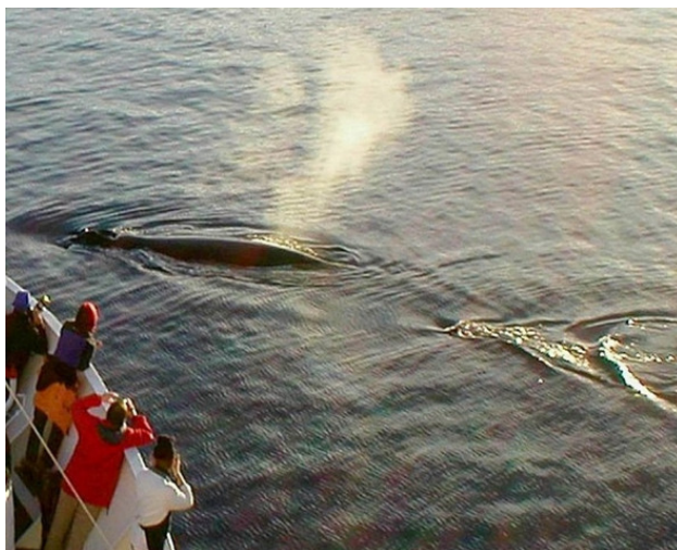
Сверху blows похожи на большие веретена темно-серого цвета