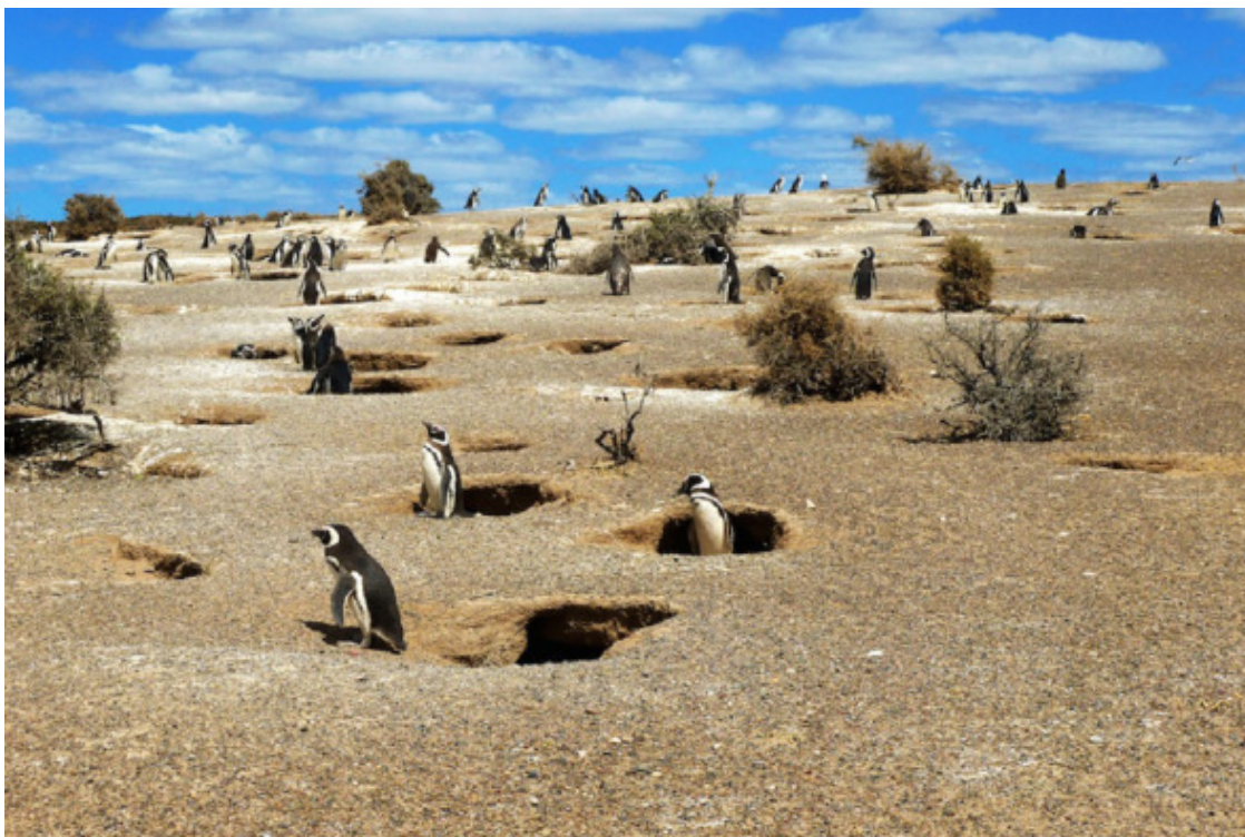
Пингвиное поселение на берегу океана