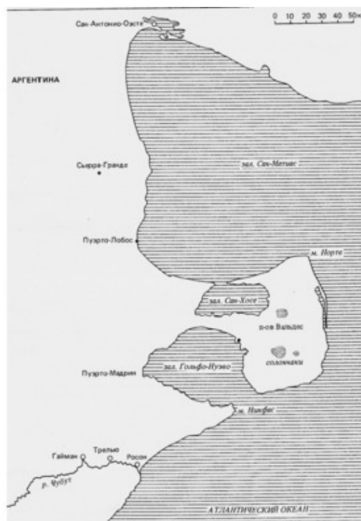
Патагония. Полуостров Вальдес