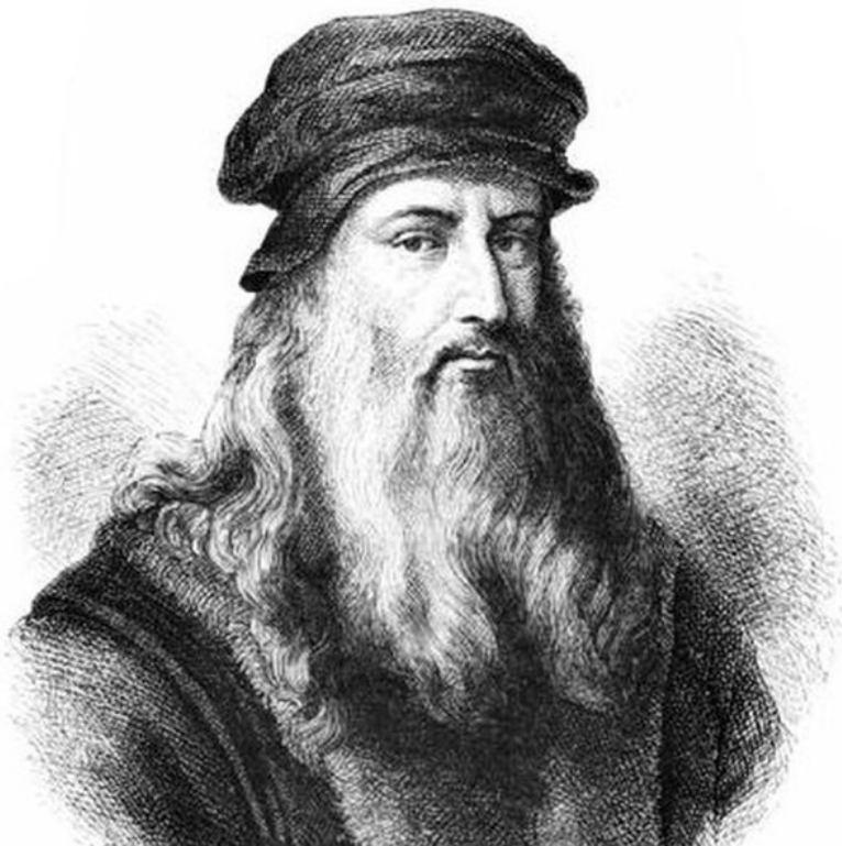
Автопортрет Леонардо да Винчи.