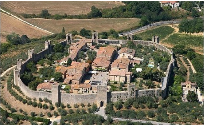
Фото деревушки Монтериджони с высоты птичьего полёта.

Дорога до деревеньки Монтериджони была удивительно хороша. Маленькие поля, аккуратно засеянные подсолнечником. Виноградные долинки такие же маленькие как аккуратные поля. Оливковые рощицы. Озерцо, с берегами поросшими клевером и аптечной ромашкой. Ослики под ездоками бежали быстро, не сбиваясь со змейки-тропинки. Весело было смотреть на этот ослиный ручеёк, в котором дети, не переставая, крутили по сторонам головами, изумлялись и восхищались, а взрослым было не до любования окрестностями. Они всё время пристраивали волочащиеся по земле ноги, пытаясь их хоть как-то приютить.