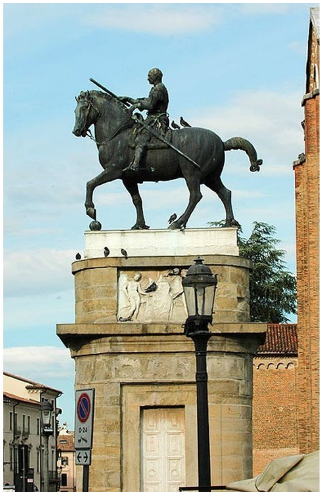
Памятник «Гаттамелату» работы Донателло.