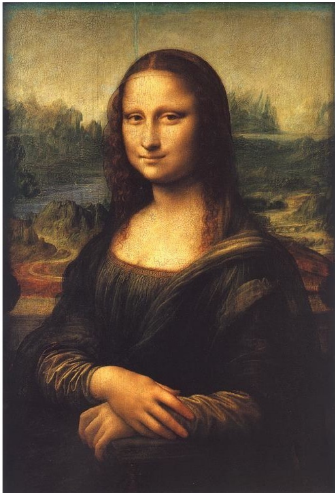
«Джоконда» – работа Великого итальянского скульптора