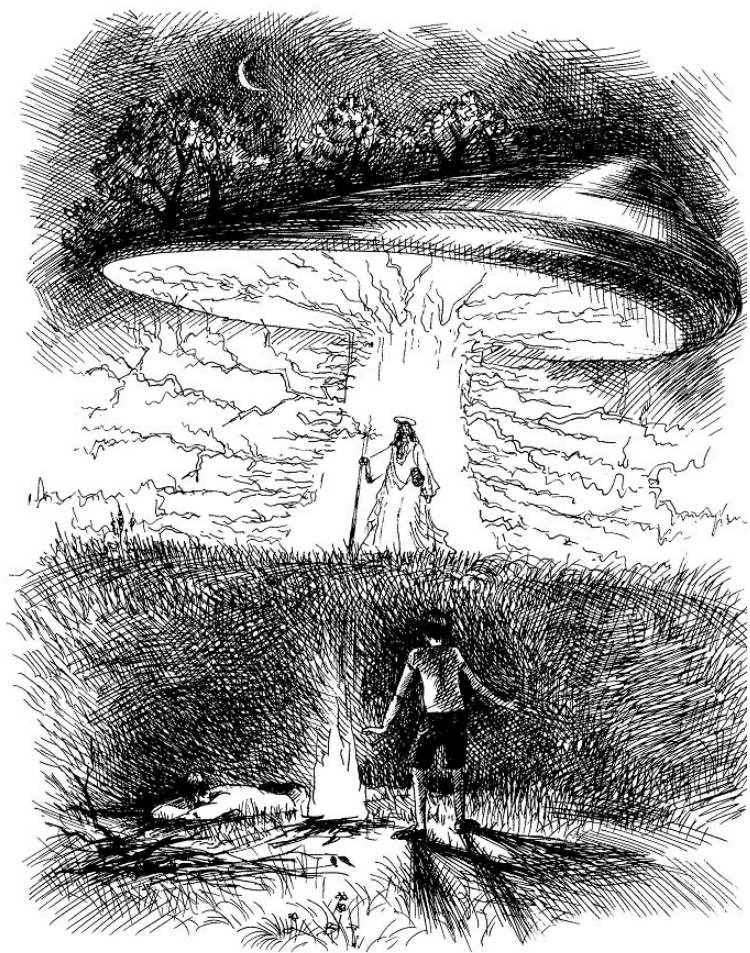
Рис. 3. 17