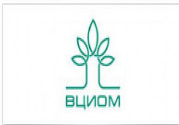
Рис. 1. Логотип ВЦИОМ – организации, регулярно проводящей социологические опросы в России и за рубежом

Главное в опросе – не выявление точки зрения отдельного человека, а получение достоверной информации об общественном мнении. Поэтому в классическом виде анкета, применяемая в социологическом опросе анонимна. Если и приводятся такие данные как сотовый телефон респондента, то с целью мониторинга. Что касается самих вопросов, которые помещают в анкету, то их классифицируют следующим образом. По содержанию: о фактах, действиях и результатах, о мотивах, оценках и мнениях; по форме: открытые, полукрытые, закрытые, прямые, косвенные; по функциональности: основные и вспомогательные, личные и безличные, вопросы-фильтры, контрольные и контактные.