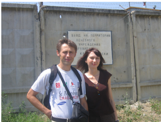
У стен Ханкалинского госпиталя

Планировали побывать в Грозном ( там развернуто строительство, реставрация ), но далеко за пределы Ханкалы не ушли, т. к. поняли, что на славянскую внешность реагируют местные жители очень своеобразно, поэтому мы вернулись с окраины Октябрьского района города. При переходе дороги на встречную полосу выехала белая «Нива» с тонированными стеклами и попыталась поравняться с нашим вектором движения, проверив нашу реакцию.