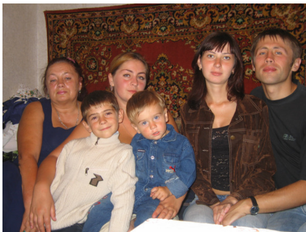
С родственниками из Киева

Возвращались в Петербург на поезде через Москву, где мы провели день. Если честно, ехала с надеждой на удачный шопинг, ну и, конечно, полюбоваться столичными достопримечательностями.