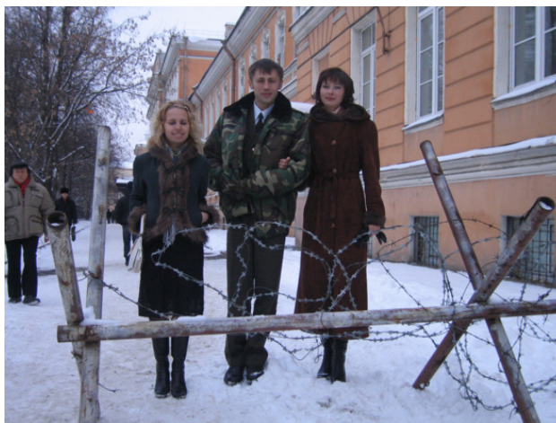
У стен кафедры военной психиатрии ВМедА