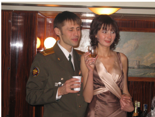
На крейсере «Аврора»