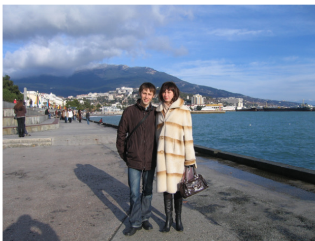
На набережной Ялты

Мы разместились в санатории. Каждое утро ходили в бассейн, гуляли, ездили на экскурсии. Большое впечатление произвел завод и институт виноделия «Магарач». Экскурсию вел профессор с хорошими актёрскими данными. Создалось впечатление, что для него важно было не рассказать о заводе и вине, а влюбить в себя аудиторию. Цитировал классиков, с таким восторгом говорил о каждом виде вина на дегустации и обвинял в невежестве большинство потребителей вина! Профессор почти с детской радостью сообщил, что пьёт в ресторанах и гостях только водку, так как вина поддельные. Даже в фирменных магазинах в большинстве своём продают подделку. Например, «Магарач» не выпускал в этом году «Херес», а в продаже он имеется. Количество виноградников сокращается (с 40 тыс. га до 18 тыс. га) и такими темпами, что к 2015 г. виноделия в Крыму не станет.