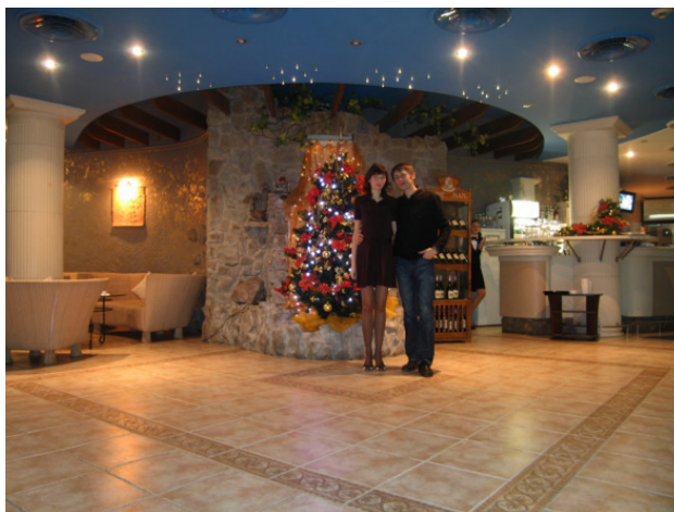
Новогодний вечер в ресторане «Ореанда», г. Ялта

Когда гостили в Киеве, ходили в зоологический музей. Где мы могли еще увидеть стрекозу длиной семьдесят сантиметров, тридцатисантиметрового комара, чучело синего кита массой сто шестьдесят тонн, олени рога четыре метра, шалаш, построенный из костей тридцати особей мамонта?! Многие витрины оформлены в виде диорам – воссоздан участок природы, и на этом фоне находятся животные.