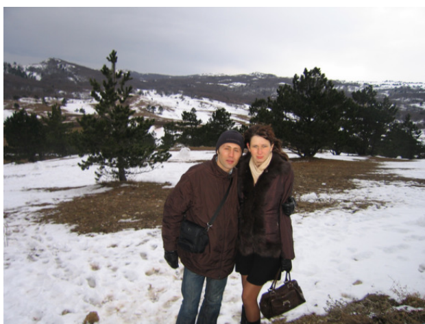
на горе Ай-Петри

В Севастополь отправились с друзьями на машине. Впечатление, что путешествовали во времени: диорама посвящена событиям Великой Отечественной войны, панорама на Малаховом кургане – обороне города 1854—1855 г.г., а древний город Херсонес был основан еще в V веке до нашей эры. Во дворце в Ливадии, как и в Ханском дворце в Бахчисарае, у меня возникло чувство, что от меня что-то скрыли, что-то не показали, о чем-то умолчали. С такой скоростью, как прошли мы, наверное, не ходили в свое время сами хозяева дворца. Двадцать-тридцать минут, и вы можете рассказать своим знакомым, что были в летней резиденции императорской семьи, там, где потом, в 1945 году, проходила знаменитая Ялтинская конференция глав СССР, США и Великобритании!