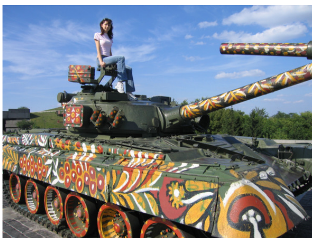
На памятнике «Нет войне»