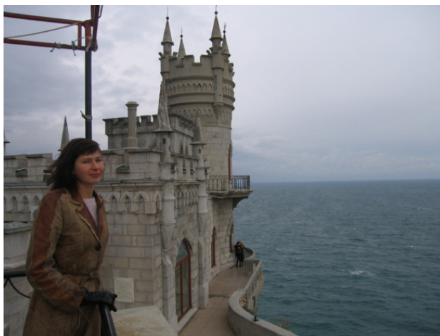
у ресторана «Ласточкино гнездо»

Когда спускались-поднимались-спускались к замку «Ласточкино гнездо», который находится на отвесной скале над морем, дул сильный ветер, от чего прогулка по многочисленным ступенькам и ухабам стала только веселее. Раньше там жил военачальник, оплакивающий свою возлюбленную (подробностей не помню, но они трагические), потом чья-то вдова, а теперь разместился ресторан с удивительно невысокими ценами.