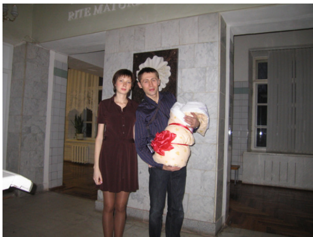
На кафедре акушерства и гинекологии ВМедА