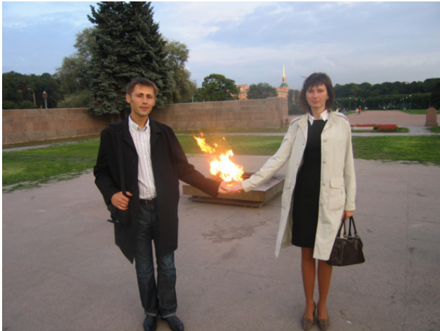
На Марсовом поле, г. Санкт-Петербург

и на удивление нескудные монологи. Не совсем можно согласиться, но я уже неделю живу под впечатлением сказанного им про отличие верующих людей от религиозных. Думаю, он об этом может судить, т.к. у него был период, когда он совсем отошел от светской жизни.