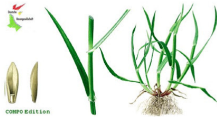
Рис. 2 – Внешний вид райграса пастбищного ( lolium perenne )

Мятлик луговой ( Poa pratensis ) – вид однодольных растений семейства злаков ( Gramineae ).