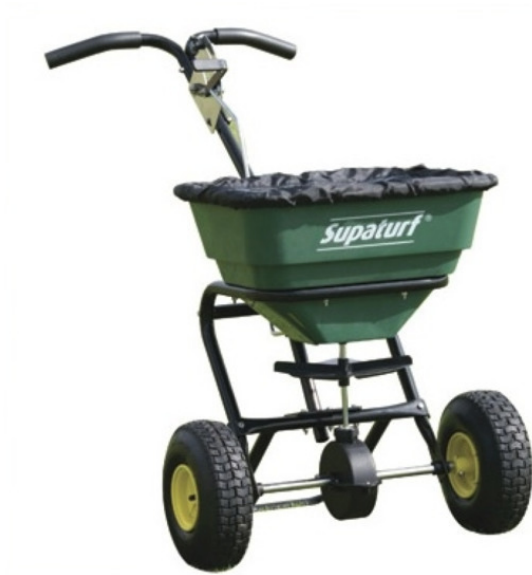
Рис. 7 – Разбрасыватель минеральных удобрений

Внесение гранулированных минеральных удобрений осуществляется с помощью разбрасывателя минеральных удобрений (рис. 7).