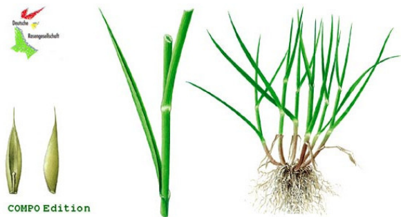
Рис. 5 – Внешний вид овсяницы красной ( Festuca rubra )

Хорошо переносит частое скашивание, образует густой нижний ярус в травостое.