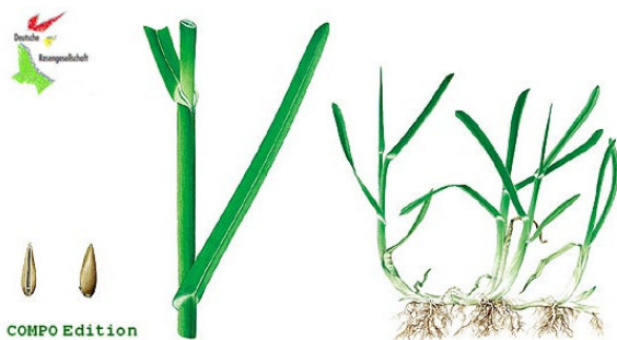
Рис. 4 – Внешний вид мятлика лугового ( Poa pratensis )

матическим условиям нетребователен. Хорошо переносит неблагоприятные условия зимнего периода, а также переуплотнение. Теневыносливость и засухоустойчивость средние, но ниже, чем у овсяницы красной.