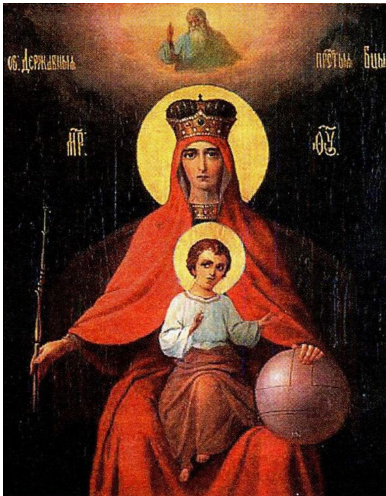
Богородица в Красном – покровительница России на Мар-