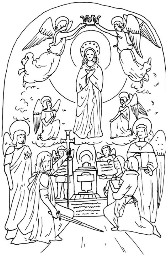
Рисунок 4. Рисунок с наброска Федерико Мадраса.

И коль вступление было открыто цитатой испанского философа, то логично его закрыть цитатой русского классика. Помните разговор Наполеона с Балашевым, посланником Александра I в «Война и мир» Л. Н. Толстого?