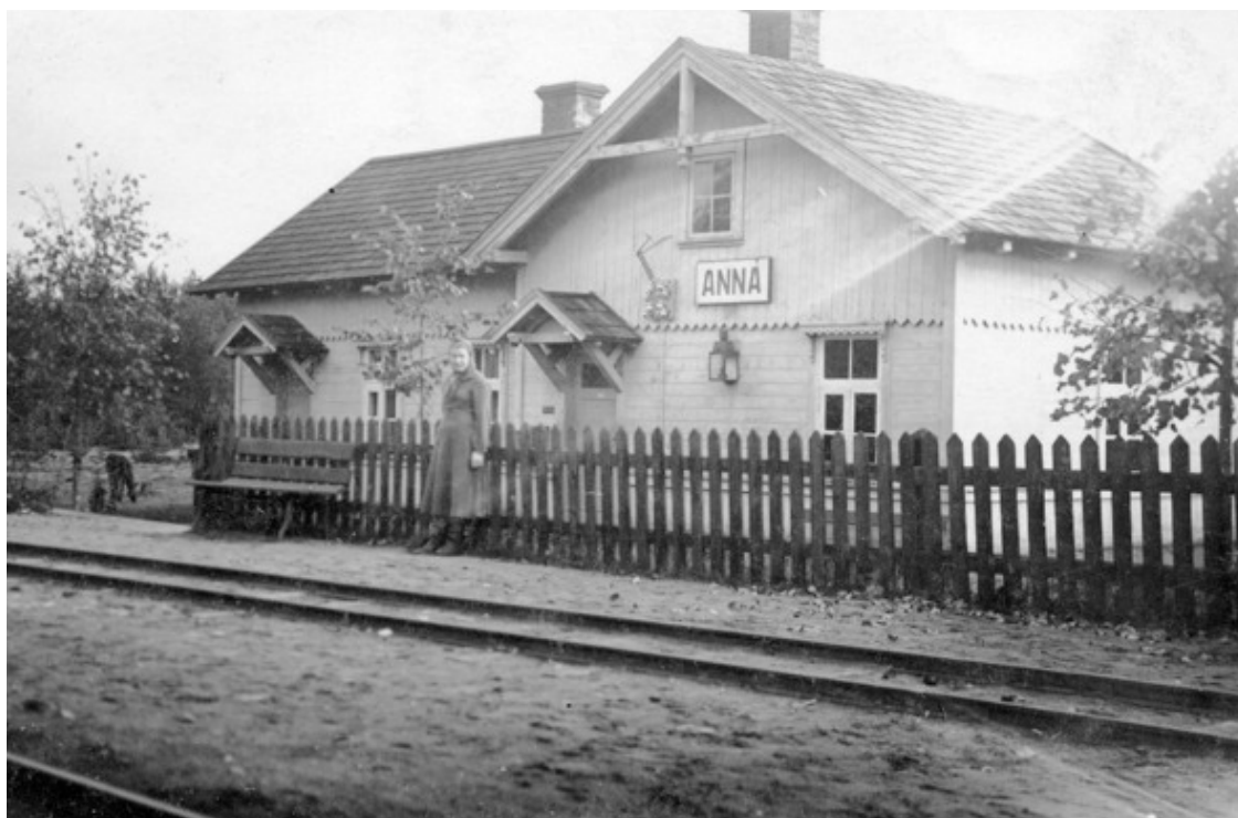
Станция Анна (восстановленная сразу после войны, 1946 г.)

В это время 374-я Любанская дивизия входила в состав 7-го стрелкового корпуса, в него же входили 245-я и 229-я стрелковые дивизии в составе 54-й армии, они были соседями слева. Соседом справа была 364-я стрелковая дивизия 123-го стрелкового корпуса 1-й ударной армии. Все они входили в состав 3-го Прибалтийского фронта армии.