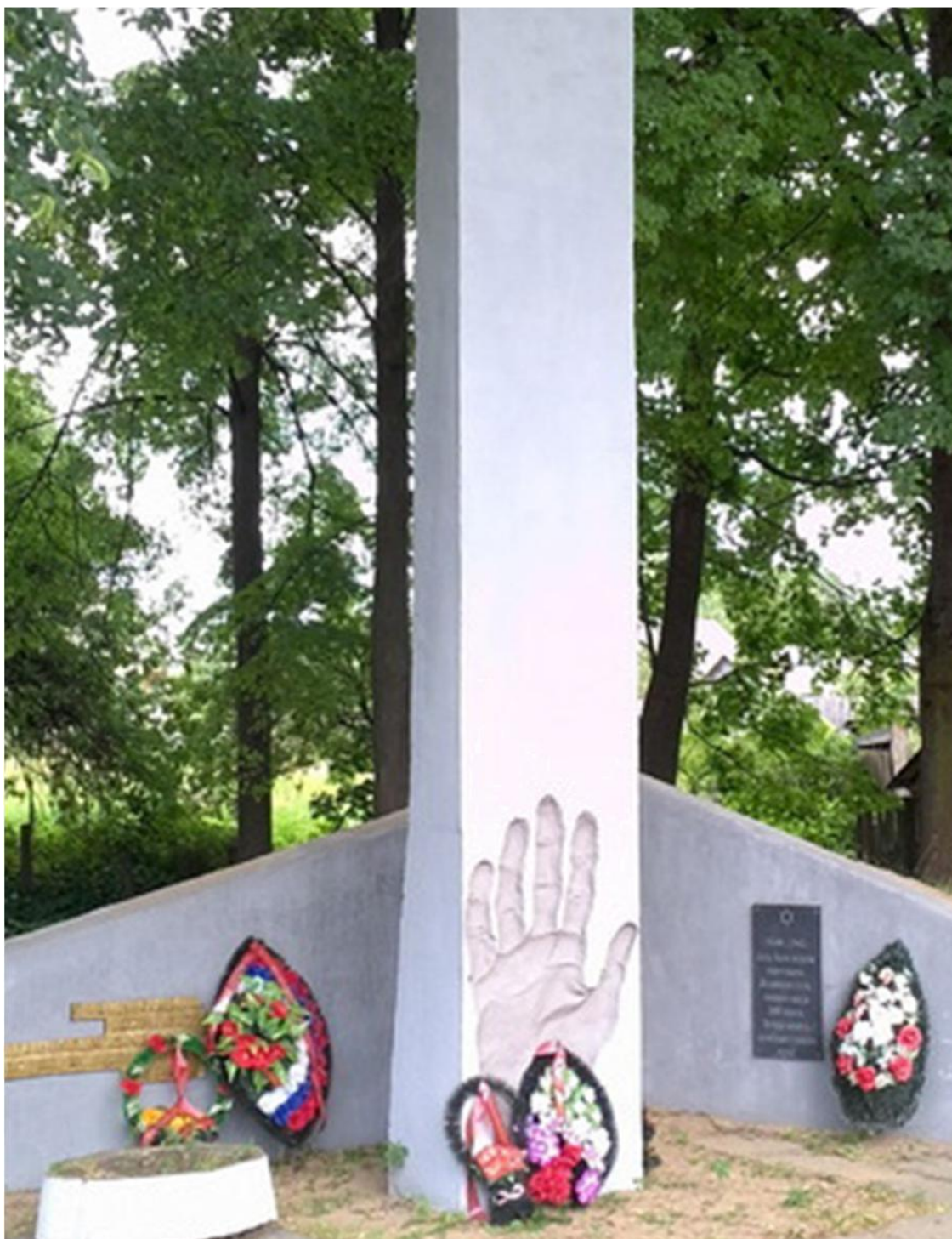
Памятник жертвам Велижского гетто.

Надпись слева: «Гражданам Велижа, расстрелянным и заживо сожжѐнным фашистами в годы Великой Отечественной войны 1941—1942 гг. От земляков».