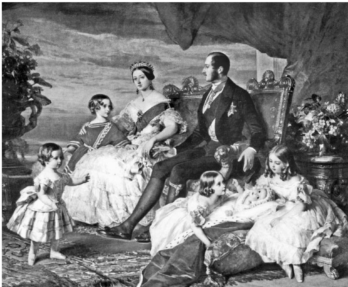
Королева Виктория, принц Альберт и их дети. Худ. Франц Ксавьер Винтерхальтер (Franz Xaver Winterhalter), 1846 г. Королевская коллекция. Букингемский дворец. Лондон.

Но вот масштабы и методы планируемой кампании действительно не имели равных в истории. И если генерал Н.Обручев относит операцию союзных войск 1854 г. к разряду уникальных, то в этом случае это имеет отношение к ее размаху. За весь XIX век это был «...один лишь пример абсолютного обладания морем».* [ Обручев Н.А. Смешанные морские экспедиции//Военный сборник, №7, СПб., 1898 г., с.39. ]