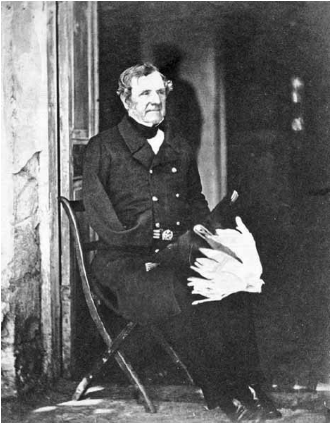
Фельдмаршал Фитцрой Сомерсет лорд Раглан. Главнокомандующий английскими войсками.

дами о самых мелочных и незначительных проблемах. Французские участники Крымской войны склонны считать, что армия страдала от него. Постоянно окружал себя интригами. В конце концов, погряз в финансовых злоупотреблениях, в том числе при обеспечении подготовки войск к отправке в Крым. В военной истории Франции оставил не самый лучший след. Хотя и провел всю кампанию в Крыму, не смог оказать сколь-нибудь существенного влияния на ее ход, оставаясь более статистом, нежели двигателем событий.