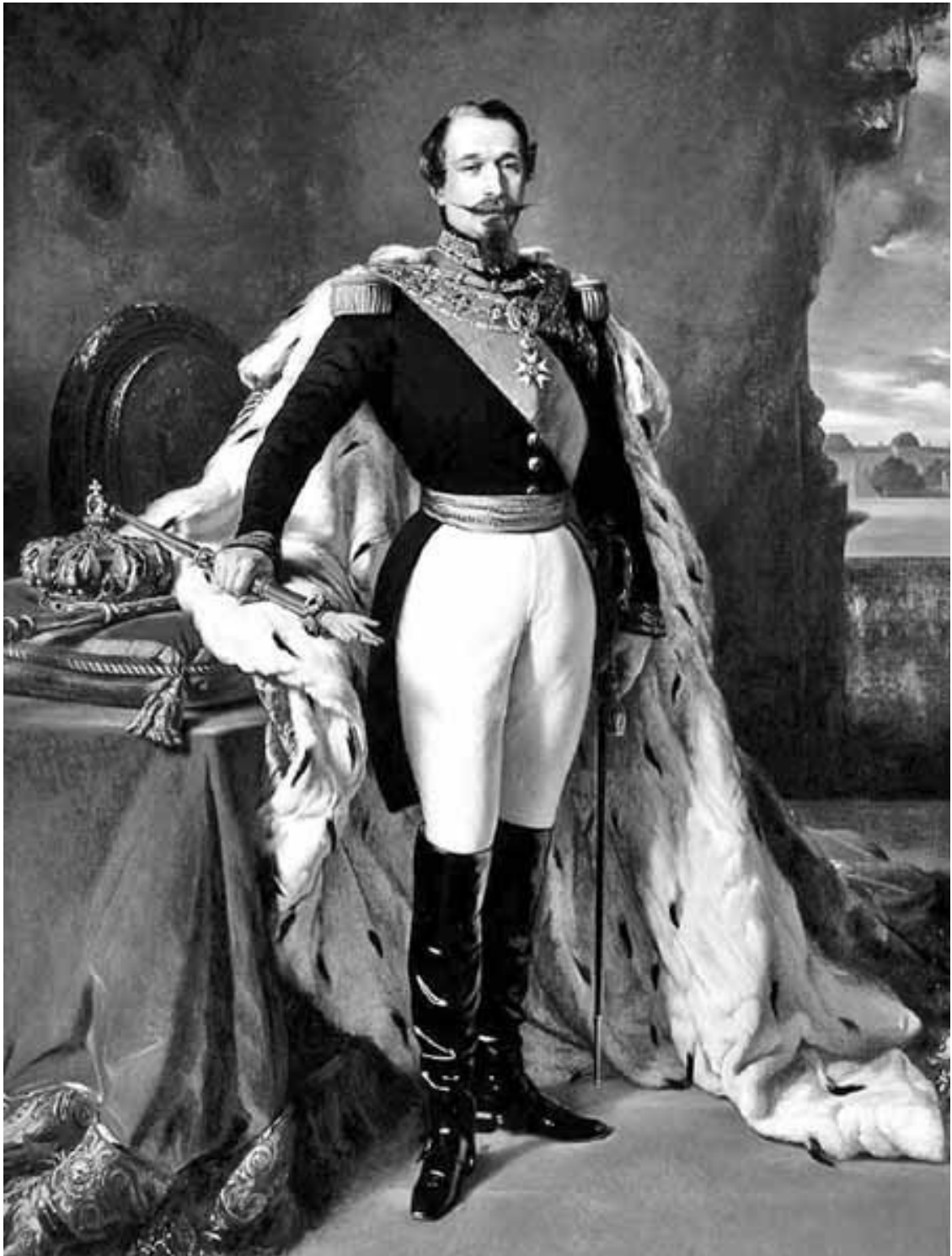
Император Шарль Луи Наполеон III Бонапарт. Худ. Франц Ксавьер Винтерхальтер (Franz Xaver Winterhalter), 1852 г. Музей Наполеона. Париж.

Новая и новейшая история, №5, 2005 г. http://vivovoco.rsl.ru .] В итоге вместо победы на море они добились победы на суше, одержать которую смогли благодаря превосходству на море.