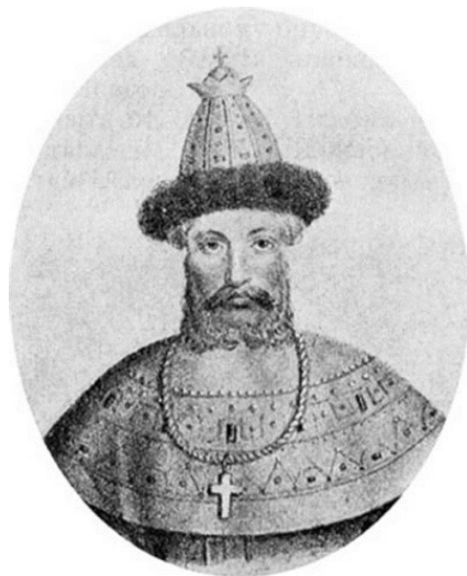
Великий московский князь Иван I Данилович Калита

Иван III отказался платить ежегодную дань Большой орде, сменившей в 1433 году Золотую орду. В 1480 году «стоянием на Угре» войск Ивана III и ордынского хана Ахмата завершилось монголо-татарское иго.