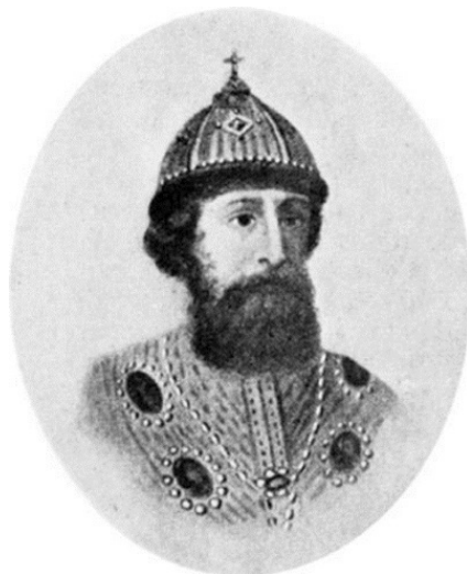
Великий московский князь Иван III Васильевич

К востоку от Кремля в 1535–1538 годы в целях обороны была сооружена кирпичная стена с бойницами – Китайгородская. От угловой – Арсенальной башни она прошла вокруг торгово-ремесленного посада и далее до Беклемишевской набережной. Толщина стены была около 6 метров, высота – более 6 метров, длина – 2,6 километра.