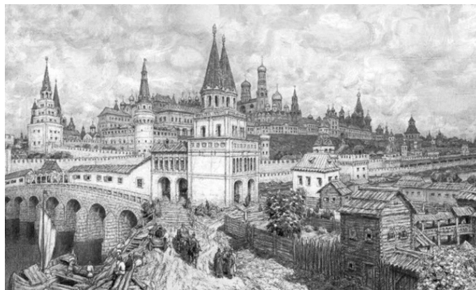
Москва древняя. XII век

Описывая древнюю Москву середины XIV века, летописцы повествуют: «Бяше град Москва видети велик и чуден град, и много множество людей в нем кипяще богатством и славою».