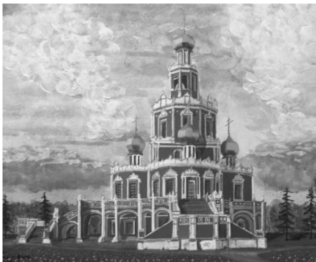
Церковь Покрова в Филях. Конец XVII века

Стране, которая крепла и «мужала с гением Петра», нужны были грамотные, квалифицированные люди. Специалистов с 1687 года готовила Славяно-греко-латинская академия, в которой помимо языков, преподавались «семь свободных искусств»: грамматика, риторика, диалектика, арифметика, геометрия, астрономия, музыка, а также богословие.