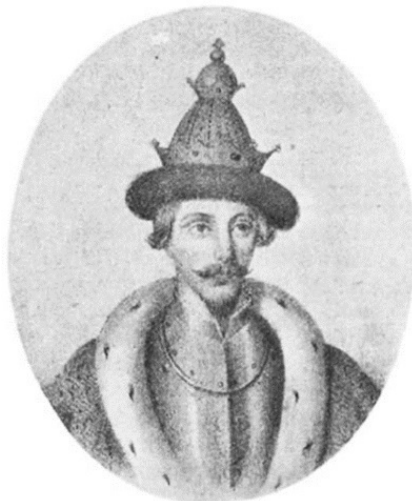
Великий князь Дмитрий Иванович Донской

В честь рождения у Василия III сына Ивана – будущего Ивана IV Грозного (1530–1584) – в селе Коломенском построили в 1532 году редкую по красоте и стройности шатровую церковь Вознесения Господня.