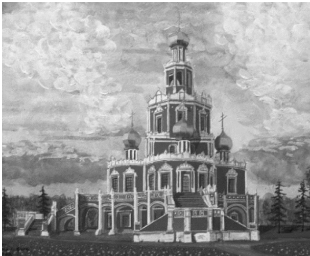
Церковь Покрова в Филях. Конец XVII века

Стране, которая крепла и «мужала с гением Петра», нужны были грамотные, квалифицированные люди. Специалистов с 1687 года готовила Славяно-греко-латинская академия, в которой помимо языков, преподавались «семь свободных искусств»: грамматика, риторика, диалектика, арифметика, геометрия, астрономия, музыка, а также богословие.