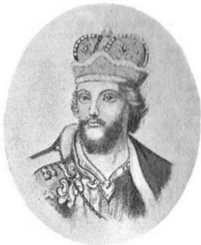
Великий князь Александр Невский

Ослаблению гнета способствовала умелая политика Великого князя владимирского, полководца Александра Ярославича Невского (1220–1263). Он защищал Русь еще и с севера – от шведов в Невской битве 1240 года, от немецких рыцарей в Ледовом побоище 1242 года.