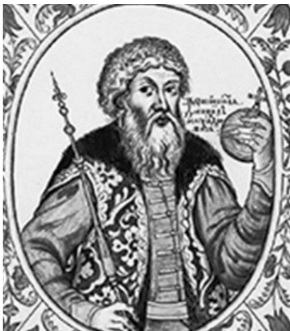
Московский князь Даниил Александрович

зя Даниила Александровича (1261–1301/3) связано начало роста Московского княжества. Собирая земли вокруг Москвы, он присоединил Коломну и Переяславль-Залесский. Для укрепления южных границ города построил на правом берегу Москвы-реки крепость-монастырь – Даниловский.