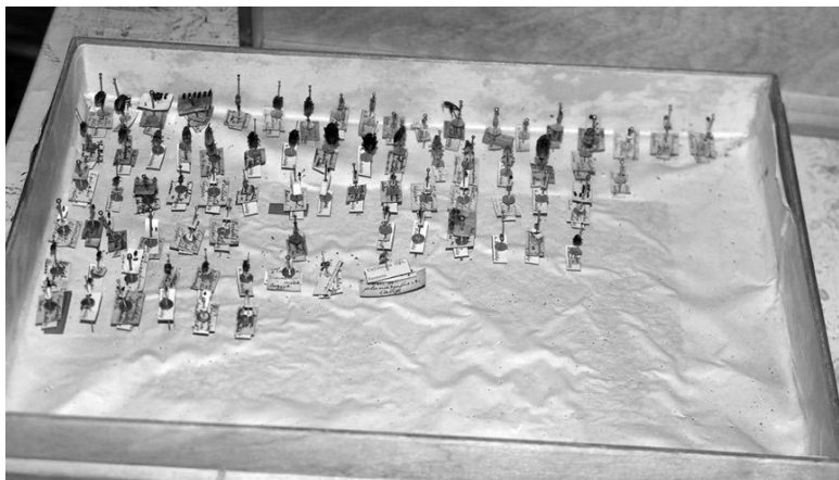
Рис. 5. Жуки из коллекции В. И. Мочульского.

В. И. Мочульский – боевой офицер, ветеран, страдающий от многочисленных ранений, профессор зоологии и поэт-мальчишка, влюбившийся в четырнадцатилетнюю сиротку: