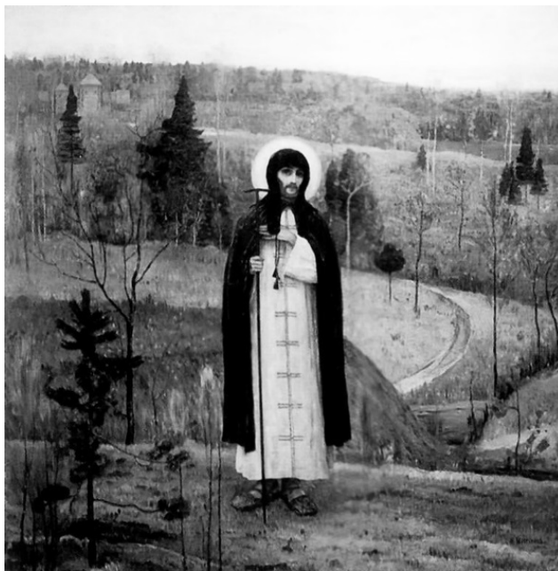
Святой преподобный Сергей Радонежский

Человек рождается в определенный момент времени и в определенный момент времени умирает. Но душа его бессмертна. Она никогда не исчезнет.