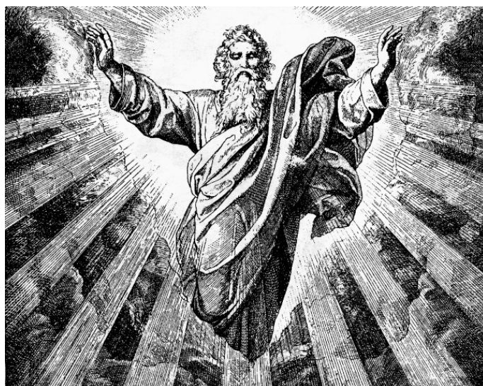
Сотворение мира. «Да будет свет!»

Бог сотворил мир, каким ты сегодня его видишь, не мгновенно. В Библии рассказывается о семи днях творения. Но мы с тобой должны понимать, что здесь речь идет не о земном дне, а о некоем космическом промежутке времени, равном, возможно, миллионам земных лет. Ведь у Бога, как сказано в Новом Завете, «один день как тысяча лет». Кроме того, нужно помнить, что Господь, рассказывая в Библии человеку о творении всего существующего, пользовался языком, который существовал много тысяч лет назад. Тогда науки с ее современными теориями и представлениями не было, поэтому повествование идет в образах, понятных древнему человеку.