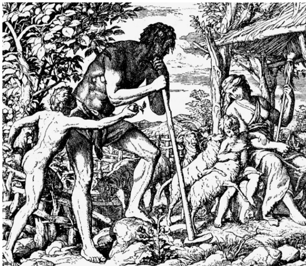
Жизнь прародителей после грехопадения