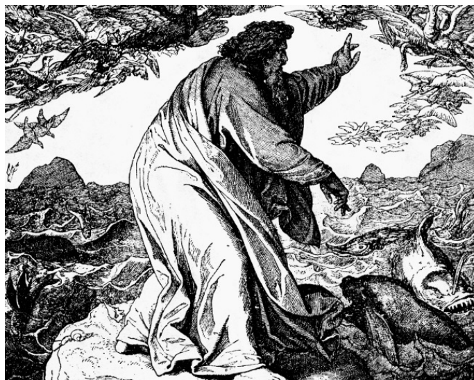
Сотворение рыб и птиц

это было сотворено из ничего, по одному лишь действию силы Божией. В течение «первого дня» материя была организована и наделена живоносной силой для дальнейшего творческого процесса. В этот же период времени был создан свет, который стала излучать материя.