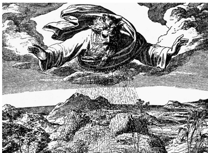
Сотворение воды и суши

О первом дне творения в Библии говорится так: В начале сотворил Бог небо и землю. Здесь небо и земля – это не наше облачное или звездное небо и не почва под ногами человека.