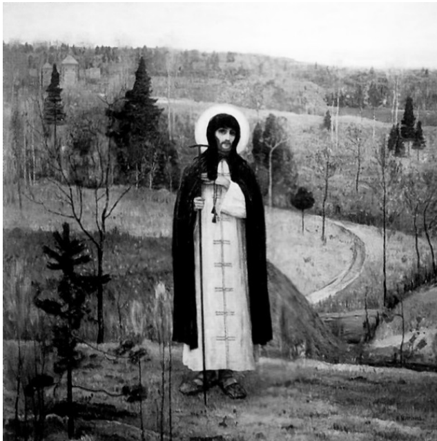
Святой преподобный Сергий Радонежский

После смерти человека душа переходит в невидимый мир. Там она не только продолжает жить, но и узнает много нового, может духовно совершенствоваться, если верила в Бога и жила по Его заповедям.