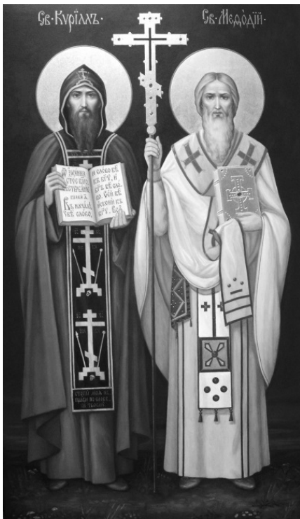
Икона святых Мефодия и Кирилла

Основателями русской письменности являются святые Мефодий и Кирилл. Они составили азбуку для перевода книг Священного Писания на язык славян, населявших в то время территорию нашей Родины. До сих пор православные люди пользуются книгами Священного Писания на церков-