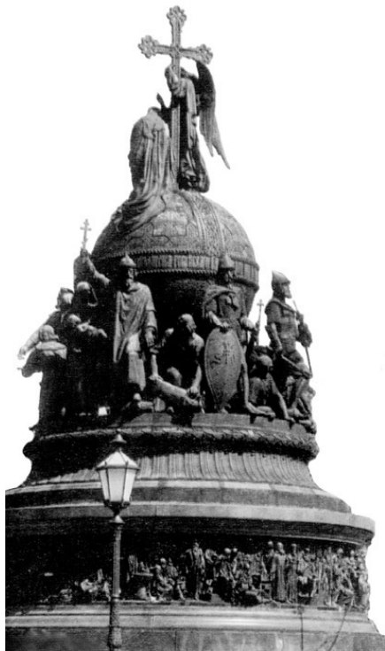
Памятник 1000-летию России в Новгороде

Ведь эгоизм и постоянная погоня за удовольствиями, кроме внутренней пустоты, разочарования и раздражения, ничего принести не могут. Жизнь полна, радостна и интересна только тогда, когда приносишь другим мир, счастье и радость. Именно тогда твоя жизнь становится духовно богатой