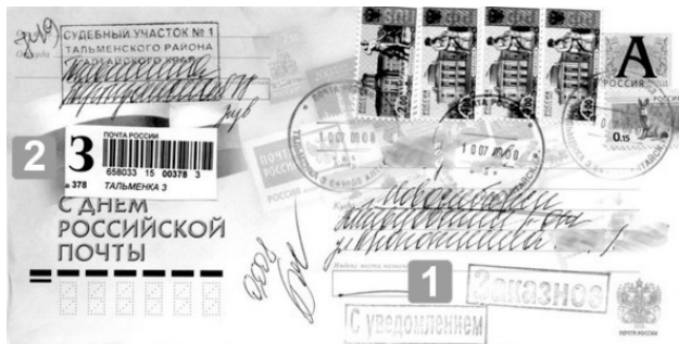
Рис. 1.13. РПО заказное с уведомлением: 1 – отметки «Заказное», «С уведомлением»; 2 – ШПИ РПО.