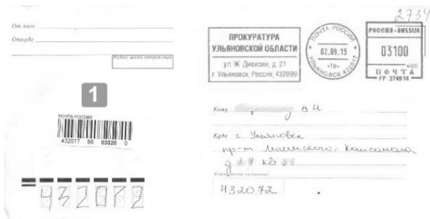
Рис.1.12. Регистрируемое почтовое отправление «обыкновенное»: 1 – ШПИ РПО.

Заказное РПО (рис. 1.13 – 1.16) – РПО принимаемое от отправителя без оценки стоимости вложения с выдачей ему квитанции и вручаемое адресату (его уполномоченному представителю) с его распиской в получении 117 . Заказное РПО подлежит доставке по адресу, указанному на ПО.