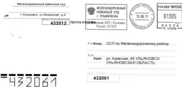
Рис. 1.11. Простое письмо.