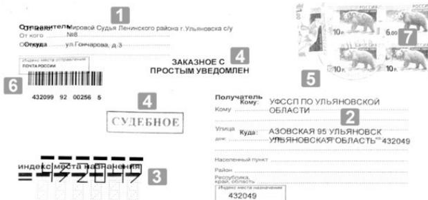
Рис. 1.1. Почтовое отправление: 1 – адресные данные отправителя; 2 – адресные данные адресата; 3 – индекс места назначения (объект почтовой связи адресата); 4 – дополнительные отметки; 5 – оттиск КППШ; 6 – почтовый идентификатор; 7 – знаки оплаты.

Календарный почтовый штемпель (КППШ) предназначен для гашения почтовых марок и оформления ПО и документов, обозначения на почтово-телеграфных отправлениях, квитанциях и документах места и даты, в некоторых случаях еще и часа приема, отправки, получения или выдачи ПО 91 .