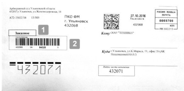
Рис. 1.14. РПО заказное без уведомления, оформленное на франкировальной машине: 1 – отметка «Заказное», 2 – ШПИ РПО.