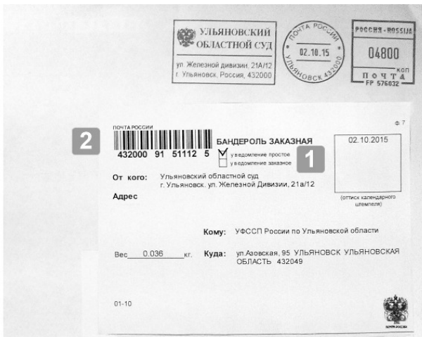
Рис. 1.15. Бандероль заказная в бумажном конверте с простым уведомлением: 1 – отметка о категории бандероли, 2 – ШПИ РПО.