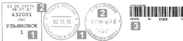
Рис. 1.2. Календарный почтовый штемпель и штриховой

Штриховой почтовый идентификатор внутренней регистрируемого почтового отправления (ШПИ) – штрих-код установленной формы с уникальным номером, присвоенным почтовому отправлению, наносимый отправителем при формировании почтового отправления или работником ОПС при приеме РПО в ОПС. Зная ШПИ можно отследить движение РПО по служебным документам и в сервисах отслеживания ПО на официальном сайте оператора почтовой связи.