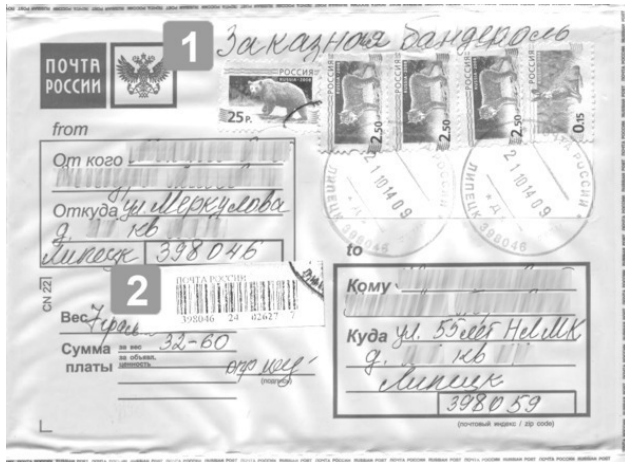
Рис. 1.16. Бандероль заказная в пластиковом пакете без уведомления: 1 – отметка о категории бандероли, 2 – ШПИ РПО.