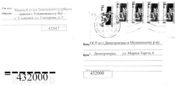
Рис. 1.10. Простое письмо.