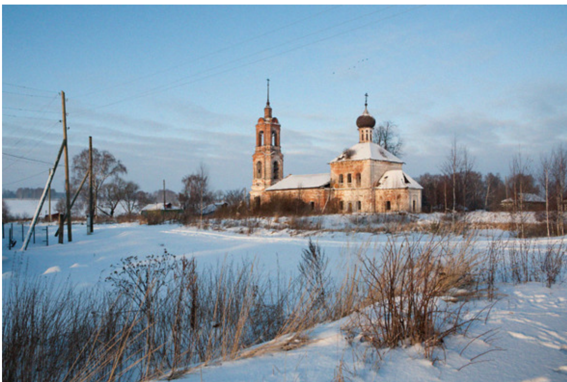
Современный вид Церкви Введения во Храм Пресвятой Богородицы.