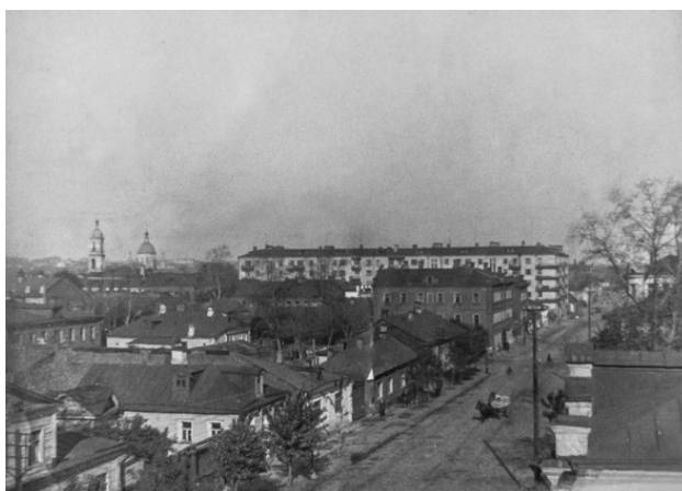
Вид из окна на Малую Андроньевскую улицу.