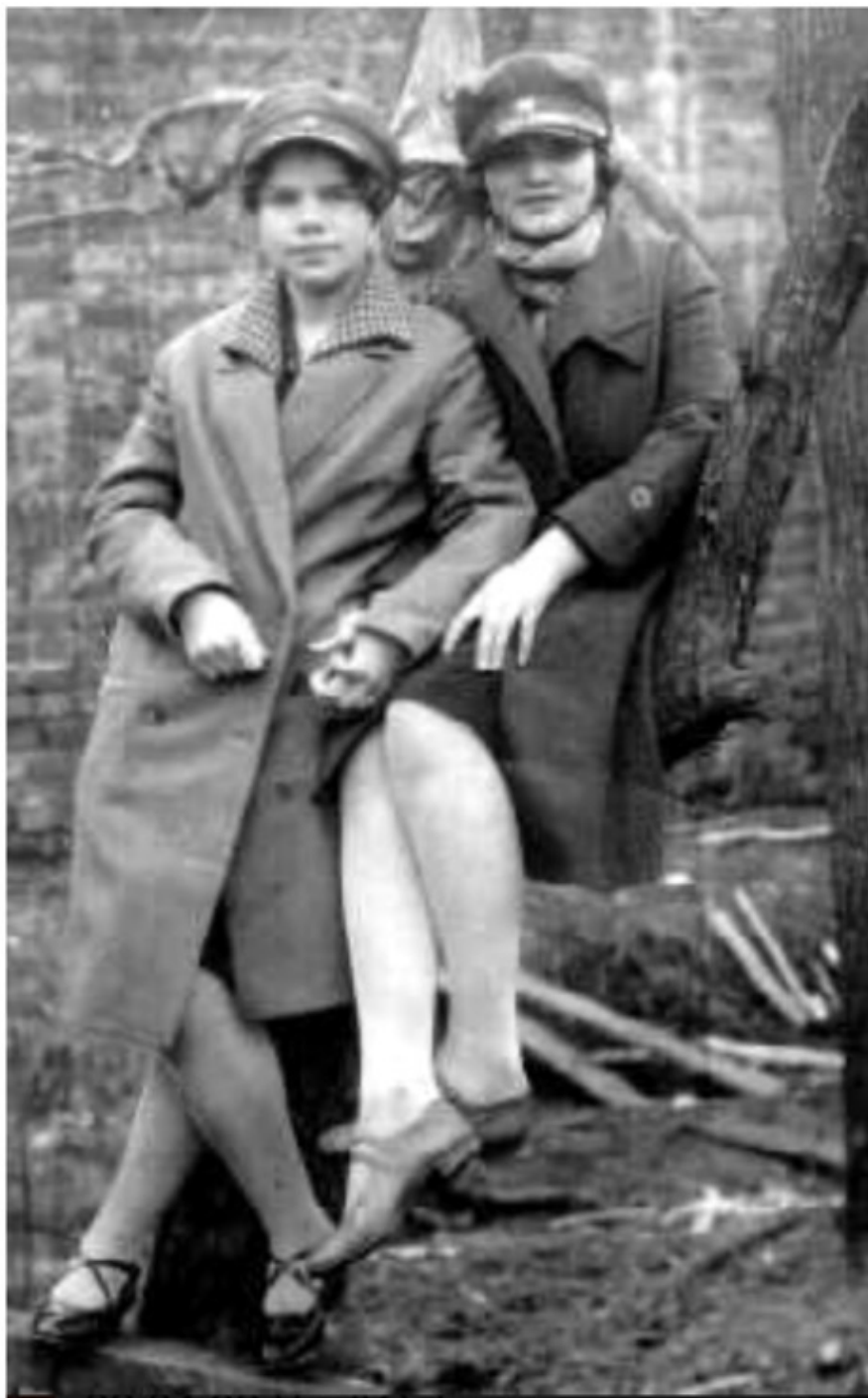
Я (слева) с подружкой, 1925 год.