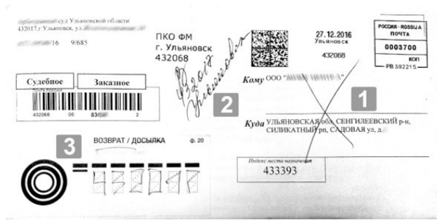
Рис. 19.1. Лицевая сторона возвращаемого ПО: 1 – перечеркнутый адрес; 2 – знак «В» и индекс ОПС места возвращения ПО; 3 – левая часть ярлыка ф. 20 со словом «Возврат» (зачеркнутым словом «Досылка»).