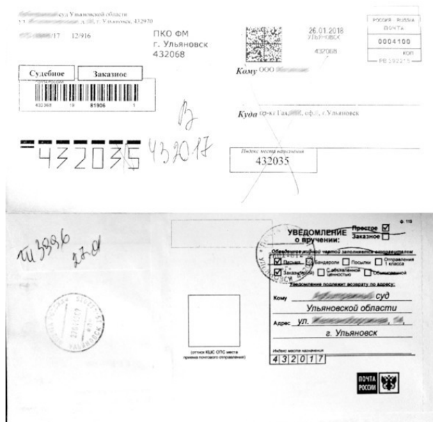
Рис. 18.3 Отсутствие на ПО отметок о причине невозможности вручения, основании и дате осуществления возврата.

В сервисе отслеживания ПО, операция возврата может сопровождаться любым атрибутом с указанием причины возврата, а также может быть просто указано «Выслано обратно отправителю» . В данном случае нет определенности в причине возврата. Такой атрибут может быть указан в Отчете об отслеживании ПО, в том числе, по причине того, что при оформлении возврата в ОПС работник ОПС, оформляющий возврат не указал причину возврата в АИС т.к. на ПО, возврат которого оформлялся, отсутствовал ярлык ф.20 и иная информация о причине возврата.