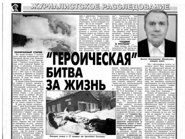
Так выглядит публикация в газете «Мир новостей».