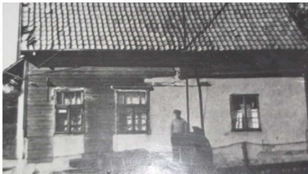
Первая контора рыбзавода.

ентири вместо маяка на конце восточного мола установили бочку, в которой сжигали пропитанное тряпьё. Пойманную рыбу хранили в сарае, в обыкновенных ваннах. Потом нашли подвал с цементным отсеком. Там солили и хранили рыбу. Шлюпки на ночь вытаскивали на берег. В подвальном помещении был склад, куда на вагонетках свозили рыбу с причала.