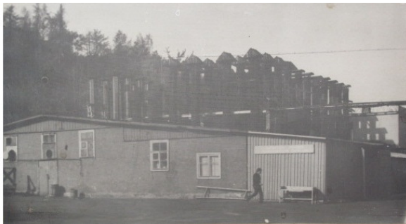
Цех копчения, построенный в 1948 году.

УТФ насчитывалось уже 46 судов. Газета «Калининградская правда» в октябре 1948 года писала: «...на месте мел-