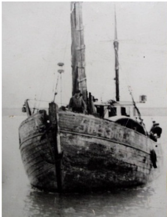
Судно типа КФК.