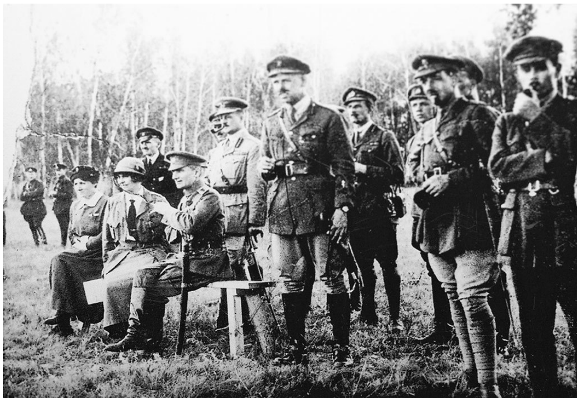
Адмирал А. В. Колчак (сидит), А. В. Тимирева (сидит рядом), генерал А. Нокс и английские офицеры Восточного фронта

В Омске шли долгие переговоры, различные персональные перестановки в проекте состава кабинета. Но дело не двигалось.