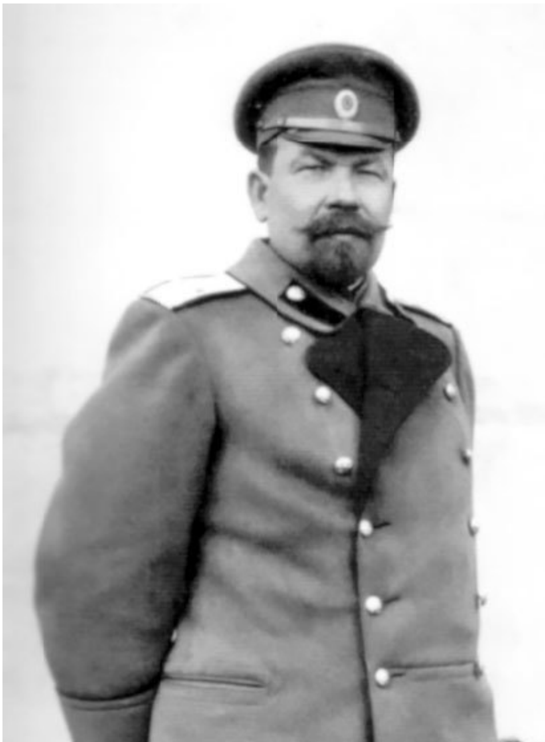
Генерал В. Г. Болдырев

Последовал чисто комический конец директории. Арестованные Авксентьев, Зензинов, Аргунов и Роговский провели тревожную, полную беспокойства ночь. Когда их наутро посетили прокурор и следователь, чтобы начать дело против офицеров, арестовавших их, то бывшие директора предстали бледные и дрожащие, прося спасти их жизнь. Им было заявлено, что им нечего бояться, что офицерам, произведшим арест, грозит военно-полевой, суд. На вопрос прокурора, что хотели бы директора, они заявили: