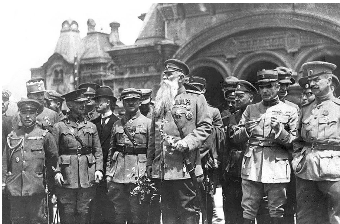
Генерал Д. Л. Хорват и военные представители Антанты во Владивостоке в 1918 г.

Едва ли найдется кто-либо сомневающийся в том, что руководило с самого начала и руководит действиями социалистических партий и их работников. Им важна не Россия и не русский народ, они рвались и рвутся только к власти, одни, более чисто убежденные, фанатики, — чтобы проводить в жизнь свои книжные теории, другие смотрят более практически, и им важна власть, чтобы быть наверху, иметь лучшее место на жизненном пиру. Борьбу между собою социалисты большевики и эсеры подняли исключительно из этих побуждающих мотивов, до России и народа им по-прежнему дела было меньше всего. И вот когда они увидели, что в этой борьбе власть попадает к самому народу, к наиболее активной, подготовленной и искренней его части, они кончили на время свои семейные счета, и эсеры пошли помогать большевикам.