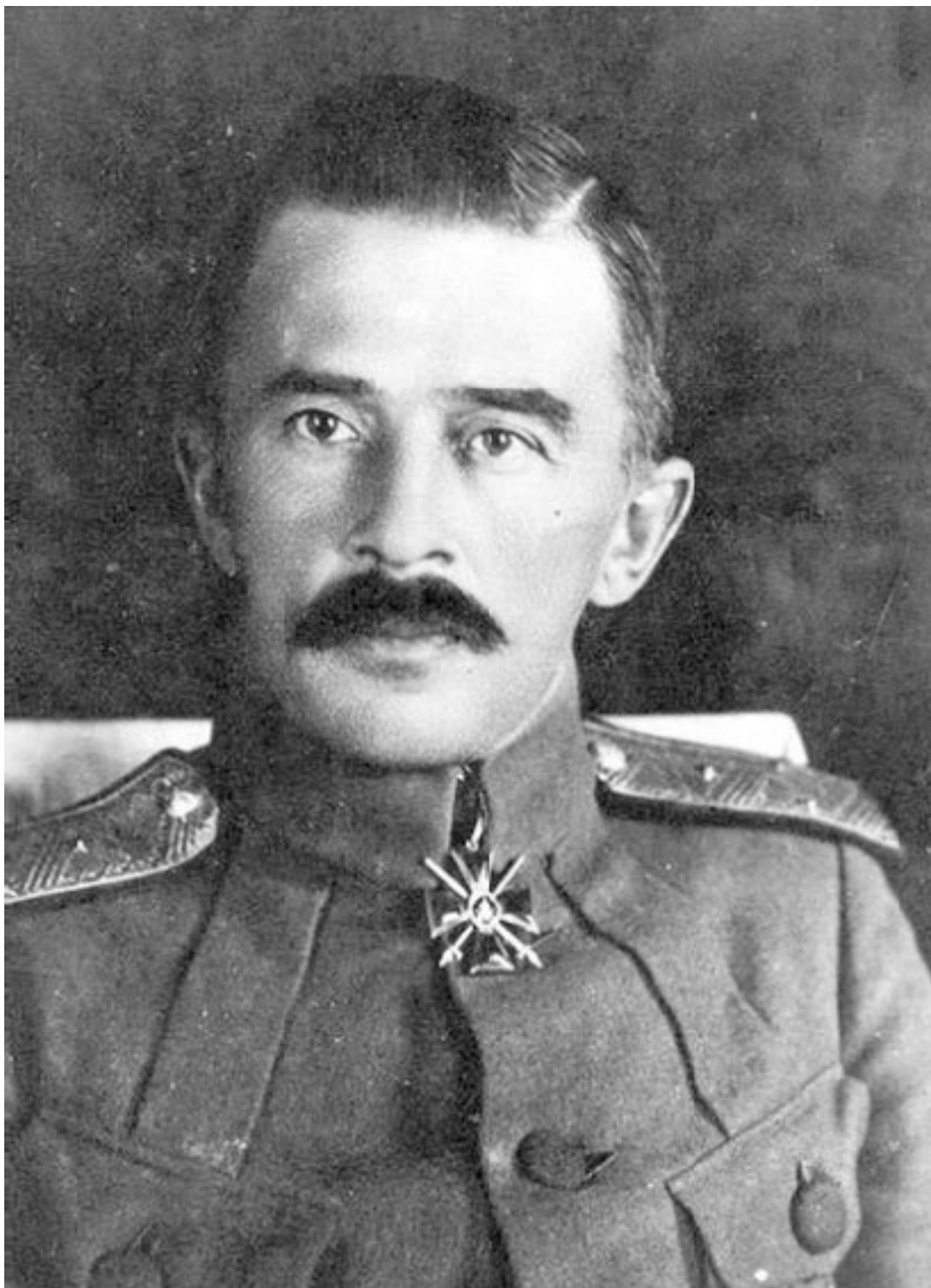
Генерал М. К. Дитерихс

Много пришлось видеть разных людей и картин чехословацкого воинства в Сибири, но, чтобы не отвлекаться, оставлю это для отдельной главы.