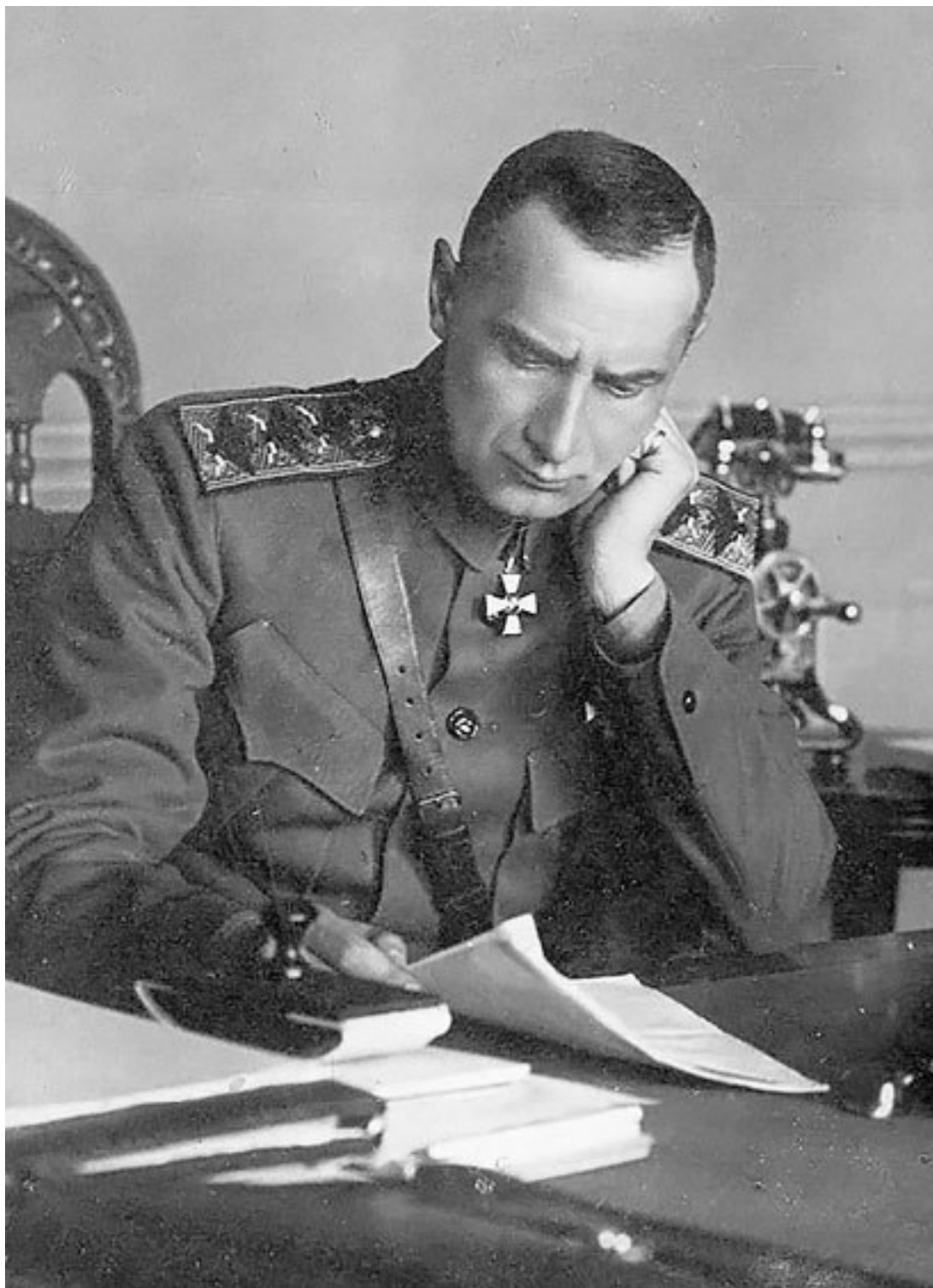
Адмирал А. В. Колчак