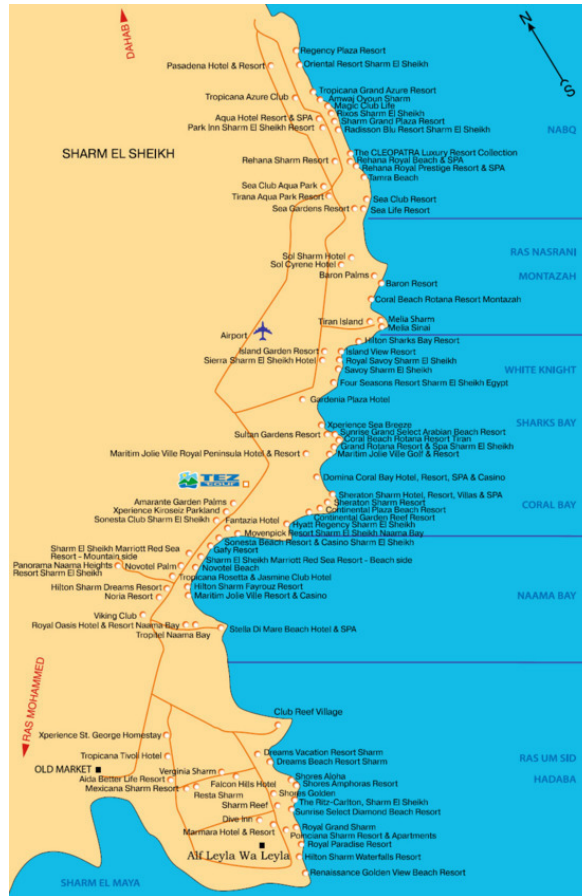
Карта отелей Шарм-Эль-Шейха