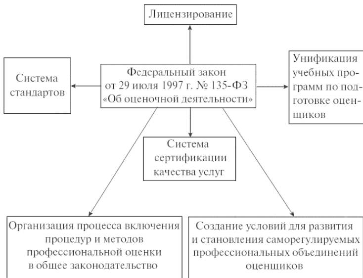
Рис. 1. Основные механизмы регулирования деятельности по оценке

Механизмы регулирования оценочной деятельности функционируют в результате деятельности как государственных, так и негосударственных органов.