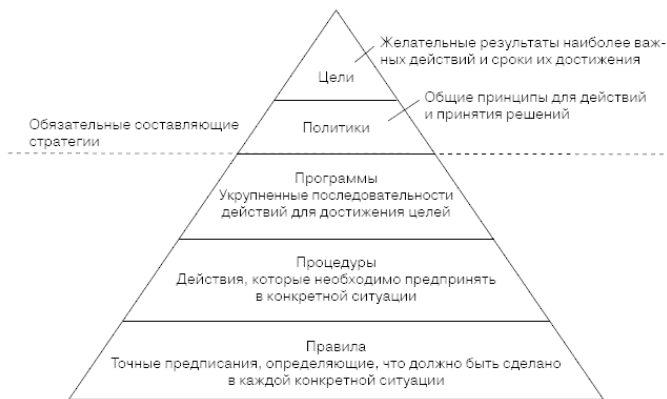
Рис. 1.2. Уровни детализации стратегии

При разработке стратегии ее основные составляющие могут быть ранжированы по нескольким уровням (рис. 1.2).