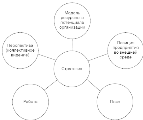
Рис. 1.1. Определение стратегии по Г. Минцбергу (концепция 5Р)

1. Стратегия как модель – неизменное в течение долгосрочного периода состояние системы «продукт – ресурсы». Стратегическая модель задает перспективное направление деятельности организации, которое позволит как можно дольше не изменять ресурсный потенциал.