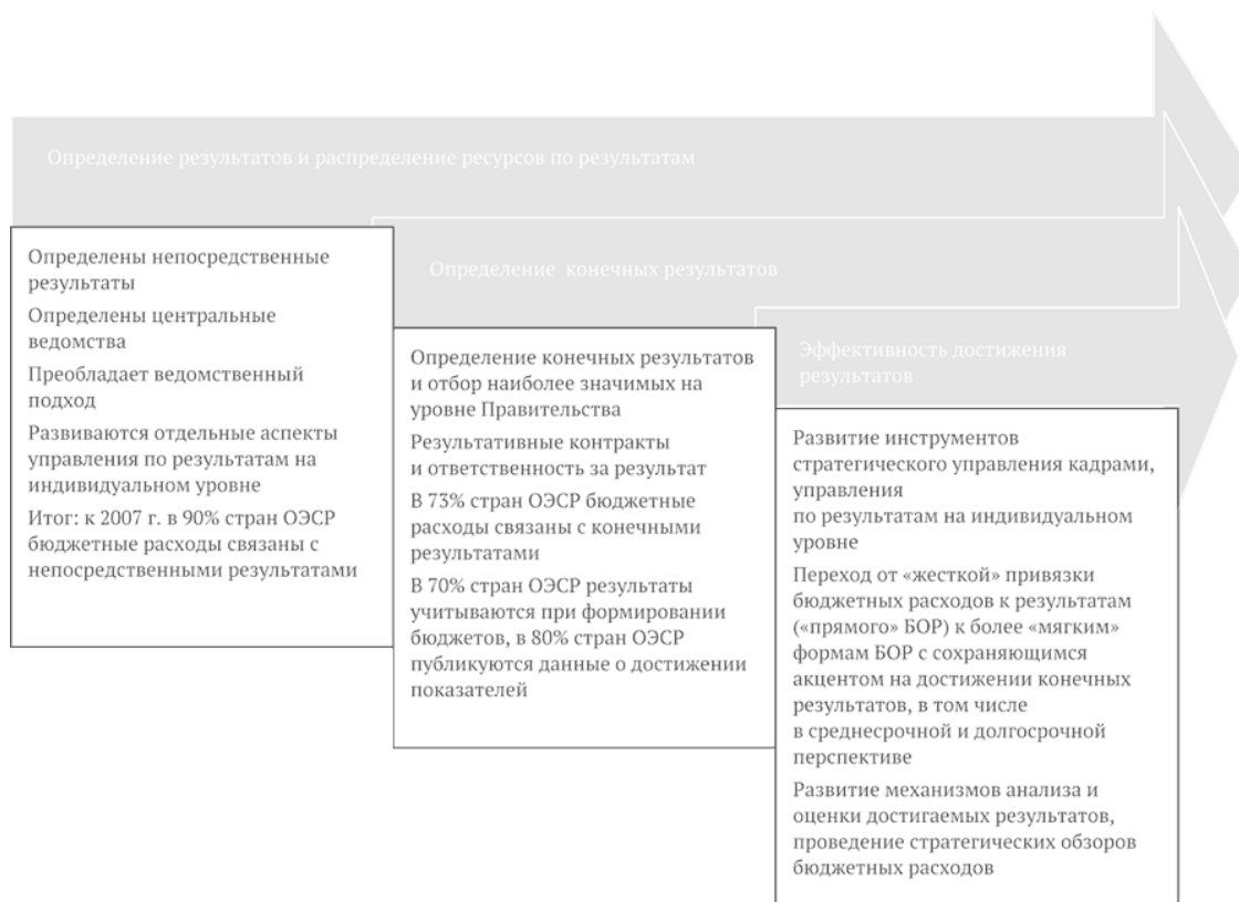
Рис. 1.1. Этапы внедрения управления по результатам в зарубежной практике

Важно отметить, что в период реализации данного этапа управления по результатам (вторая половина 1990-х – 2008 г.) данные управленческие модели получили распространение не только в развитых странах, но и в странах с переходной экономикой и крупнейших развивающихся странах (Китае, Индии, странах Латинской Америки). На этот же период приходятся и первые усилия по внедрению управления по результатам в России.