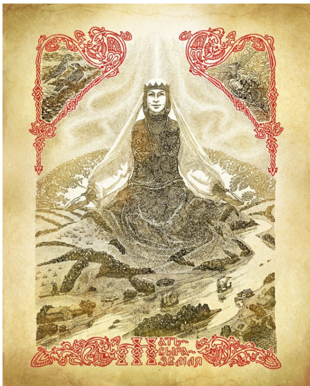
Богиня моего народа Мать-сыра-земля

Мне больно, что моя земная родина, мои соотечественники так далеки от образа небесной Родины и родного народа, каким я его помню – этих двух образов, живущих в моём сознании. Но это не повод для нелюбви к Родине и народу, преобразённому течением жизни.