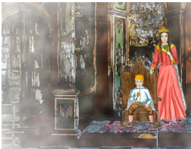
Король Буби Первый с мамой

Буби был милым маленьким мальчиком. Когда в праздники на него надевали золотую корону и расшитые золотом одеяния, все это золото не могло затмить яркость его волос, а горностай на мантии не был таким мягким, как его щеки и руки. Он был похож на маленькую дрезденскую китайскую фигурку, которую вместо камина посадили на трон.