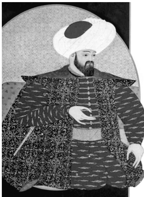
Осман I Гази – первый османский султан, сын князя Эртуг

хана, превратившего султана сельджуков в исправного плательщика дани. К концу XIII века власть на этой территории перешла в руки нескольких практически независимых племенных вождей. Одним из них был Осман (по-арабски: Оттоман 2 ) – сын Эртугрула, унаследовавший вотчину отца в 1281 году. А еще через короткий срок, в 1299-м, он провозгласил независимость от султана сельджуков, и уже никто не смог возразить ему. С того времени, как утверждают историки, начался путь Османа-завоевателя. Изначально его ханство было одним из многих новообразований на теле разорванной державы сельджуков, однако вскоре династия Османа, одолев большинство соперников, основала мировую империю, 600 лет носившую это легендарное имя.