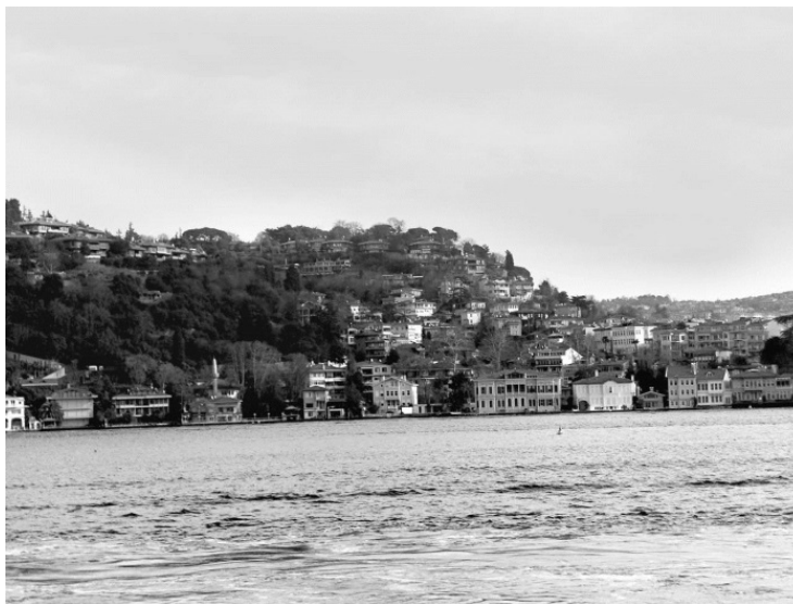
Вид на Стамбул со стороны Босфора.

Стамбул не зря называют городом солнца: подсчитано, что в год здесь светит 2000 солнечных часов. Да и погода для путешествий почти всегда комфортная: средняя температура в холодное время года здесь составляет около 10 градусов. Лето в Турции жаркое, поэтому для отдыха и познавательных экскурсий лучше выбрать весну или осень.