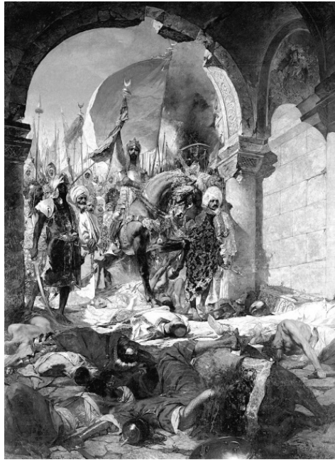
Вступление Мехмеда II в Константинополь. Художник Жан-Жозеф Бенжамен-Констан

29 мая 1453 года Мехмед II торжественно вошел в храм Святой Софии. Весь город был отдан на трехдневное разграбление. Остатки греческого войска были перерезаны, старики, женщины и дети проданы в рабство.