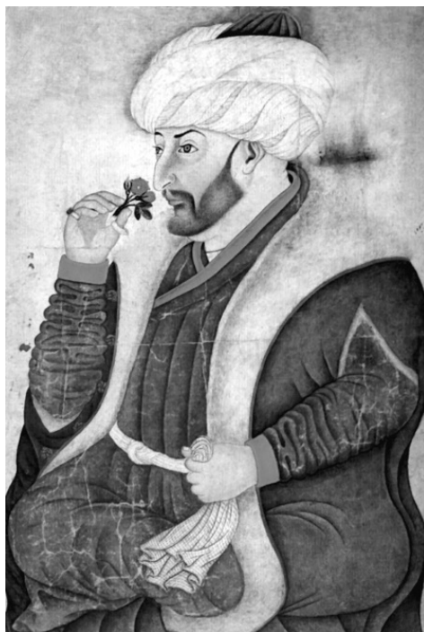
Мехмед II Завоеватель (Фатих)

папе, а тот направил к нему кардинала Исидора в сопровождении... 200 солдат. Но даже эту мизерную помощь горожане истово отвергали. При упоминании кардиналом в соборе Святой Софии имени папы прихожане стали кричать и скандировать: «Лучше турецкий тюрбан, чем папская тиара!».