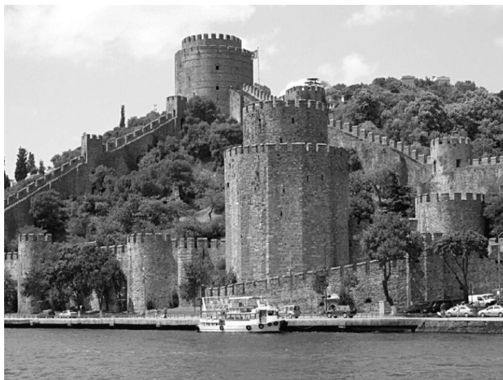
Крепость Румели Хисар

В 1453 году, после продолжительной осады, город сдался янычарам Мехмеда Завоевателя (1432–1481 гг.). Османский султан, грезящий о славе Александра Македонского, представлял себя властителем мира. Он желал стать главным героем исторических эпосов и легенд, как его великие предшественники. Мехмед переименовал Константинополь в «Иstanbul» и провозгласил его столицей Османской империи. Название пошло от «Истинполин», которое использовали арабы в Средневековье. Оно, в свою очередь, берет начало от греческой фразы «ис тин Полин» и переводится как «в город». Однако Стамбул (Istanbul) до 1930 года официально именовался Константинополем, но затем турецкими властями было предписано использовать только турецкий вариант названия – «Иstanbul».