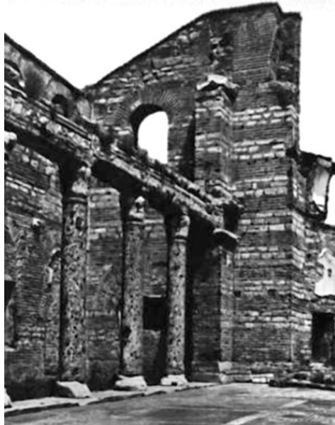
Базлика св. Иоанна Студита в Константинополе (руины византийской постройки)

Четвертый крестовый поход, ознаменовавшийся захватом и разграблением столицы Византии Константинополя, подтвердил существование глобального, мирового масштаба, раскола – вражды между Римско-католической церковью, приверженной папе, и греческой Православной, патриарх которой подчинялся императору. Разногласия и вражда позволили смелым и хищным захватчикам с мусульманского Востока постепенно выйти из тени, заняв ключевые позиции в переделке мира. Тюрки надвигались, и остановить их было некому.