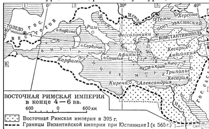
Восточная Римская империя в IV–VI вв.

И если бы не было упадка восточного христианства, не было бы и мощной экспансии турок. Новая Римская империя со столицей в Константинополе ослабевала, на отдельных ее направлениях и территориях уже хозяйничали более успешные венецианцы, генуэзцы, турки.