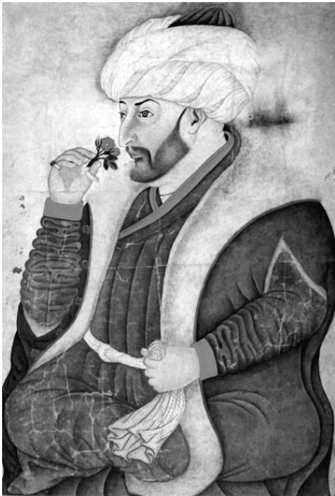
Мехмед II Завоеватель (Фатих)

В преддверии штурма Константинополь выглядел следующим образом. Город был обнесен тремя рядами стен со рвами между ними, которые были заполнены водой; на стенах находились сторожевые башни; имелись широкие проходы для передвижения войск. Городские стены за время своего существования уже выдержали двадцать осад, но теперь их