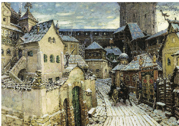
4 Картина А. Васнецова «Ранним утром в Кремле»