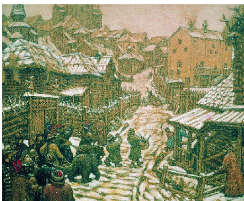
5. А. Васнецов «Медведчики»

1. Речь Посполитая (Польша-зависимая Украина+Великое княжество Литовское) в границах 1619 года в сравнении с границами современных государств. 1) Королевство Польское (Корона), 2) Герцогство Пруссия – вассал Короны, владение Тевтонского Ордена. До того это т.н. госпитальное братство (девиз: Помогать-Защищать-Исцелять), вышедшее из ордена Госпитальеров, переродившееся, едва ли не в свою противоположность, неоднократно атаковало княжество Литовское но, в 1410 г. потерпело сокрушительное поражение в битве под Грюнвальдом от польско-литовских (русских) войск под командованием Ягайло и его двоюродного брата Витовта. 3) – Великое княжество Литовское, 4) Задвинское герцогство, кондоминиум Литвы и Короны, 5) Герцогство Курляндия и Семигалия, вассал Литвы, с 1569 года – Речи Посполитой.