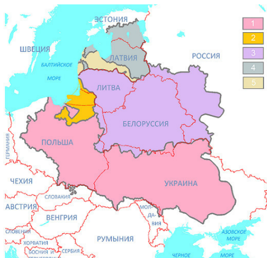
1. Карта речи Посполитой