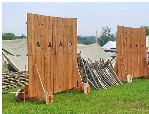
2. Гуляй-Город. Прimitивная реконструкция