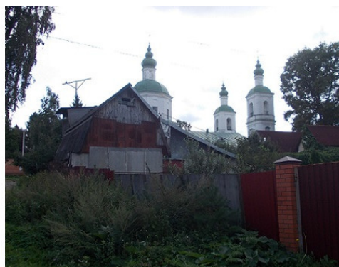
3. Фотография места сражения при Молодях