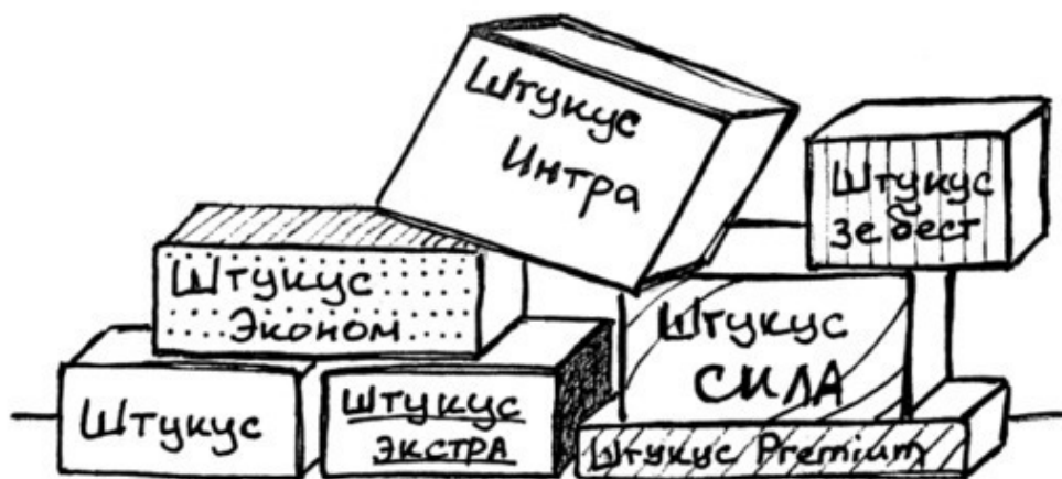
Рис. 4. «Штукус»