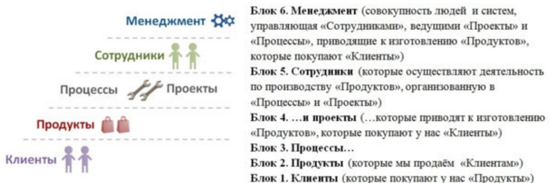
Рис. 2. Клиенты – Продукты – Процессы/Проекты — Сотрудники – Менеджмент

Для диагностики подойдёт следующая структура ( будьте внимательны: читается снизу вверх ):