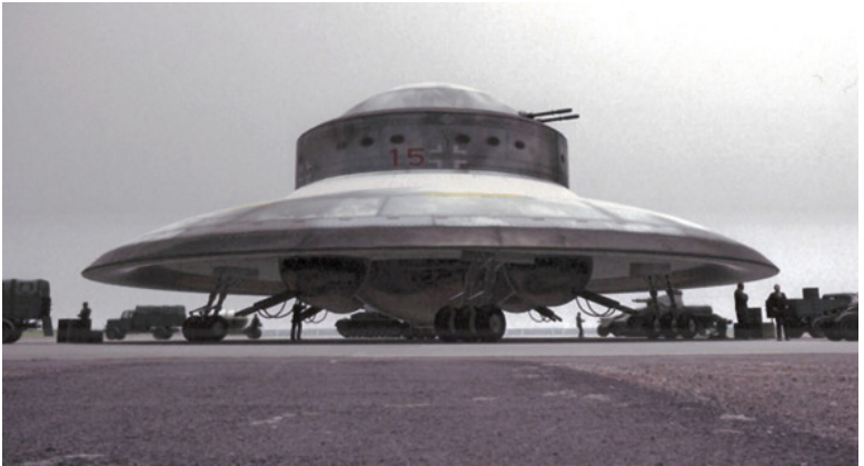
Фото из германских архивов (1944 г.)

Удивительно, но аппарат, запечатлённый на них, не просто напоминает, а является точной копией совсем другого аппарата, изображённого совсем на других снимках, сделанных совсем в другое время.